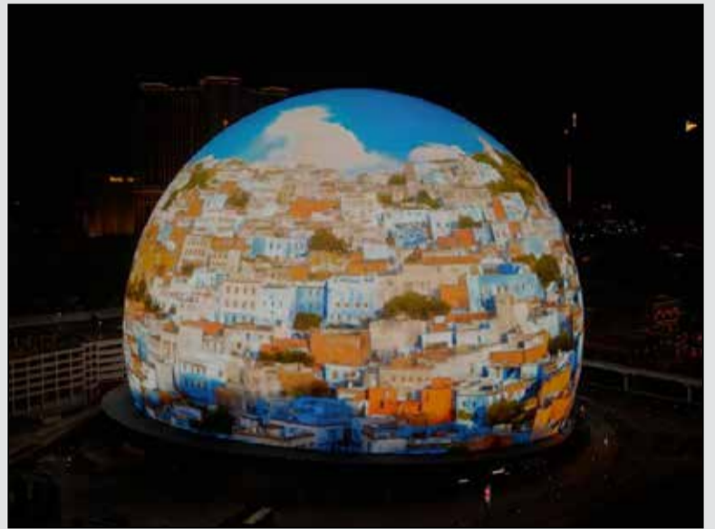
Le Maroc s'invite sur l'écran du monde.