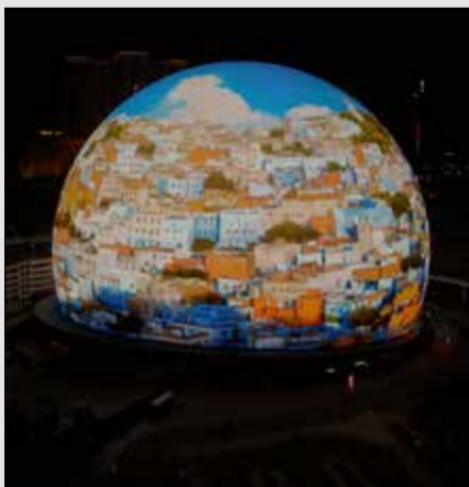
Le Maroc s'invite sur l'écran du monde.