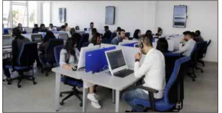
Un secteur confronté à de multiples défis.

Les syndicats du secteur du BPO (Business Process ou Outsourcing) et des centres de contact de France, de Tunisie et du Maroc se sont réunis le dimanche 21 juin 2026 à Casablanca à l'occasion d'une rencontre intersyndicale internationale consacrée à l'avenir de la profession. Cette réunion s'est tenue dans un contexte de profondes mutations du secteur de la relation client, confronté à une double menace. D'une part, le déploiement accéléré des technologies d'intelligence artificielle, susceptibles d'automatiser une part croissante des activités des centres de contact. D'autre part, le durcissement