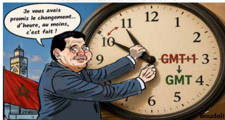
Akhannouch met fin à GMT+1