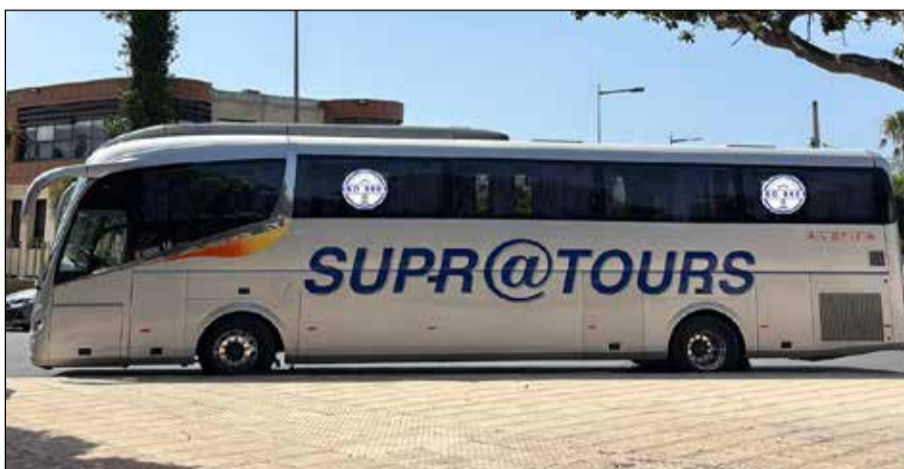
L'ambition de Supratours est de proposer une offre de mobilité toujours plus fiable.

Cette certification couvre l'ensemble des implantations de Supratours à travers le Royaume ainsi que ses principaux métiers : le transport interurbain de voyageurs, le transport touristique et de personnel, ainsi que les activités de messagerie opérées sous la marque Suprabox. Au-delà d'une