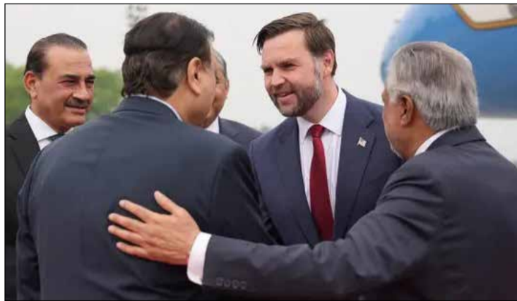
Le vice-président US JD Vance lors de son arrivée au Pakistan.

Le vice-président a également révélé qu'un mécanisme imaginé par Jared Kushner permettrait aux États-Unis et au Qatar de conserver un droit de regard sur les fonds iraniens dégelés après leur restitution à Téhéran. Ces ressources seraient exclusi-