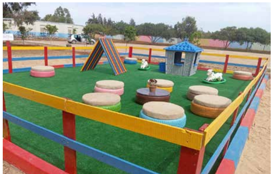
L'action de la Fondation a porté sur la rénovation de quatre écoles dans la province de Berkane et de deux autres dans la province de Taourirt.

Cette nouvelle phase a porté sur la rénovation de quatre écoles dans la province de Berkane et de deux autres dans la province de Taourirt, au bénéfice de 687 élèves dont les conditions d'apprentissage et de vie scolaire ont été significativement améliorées. Les travaux réalisés ont concerné notamment la réfection des peintures, l'étanchéité des bâtiments et la modernisation des installations sanitaires. Des espaces verts et des aires de jeux ont également été aménagés afin d'offrir aux élèves un cadre scolaire plus agréable, plus sûr et davantage propice à leur épanouissement. En marge de cette cérémonie, la Fondation Banque Populaire a mené, en partenariat avec le groupe Sapsess-Sochepress, une opération de distribution de livres au profit des élèves des deux écoles réhabilitées dans la province de Taourirt. Cette initiative vise à en-