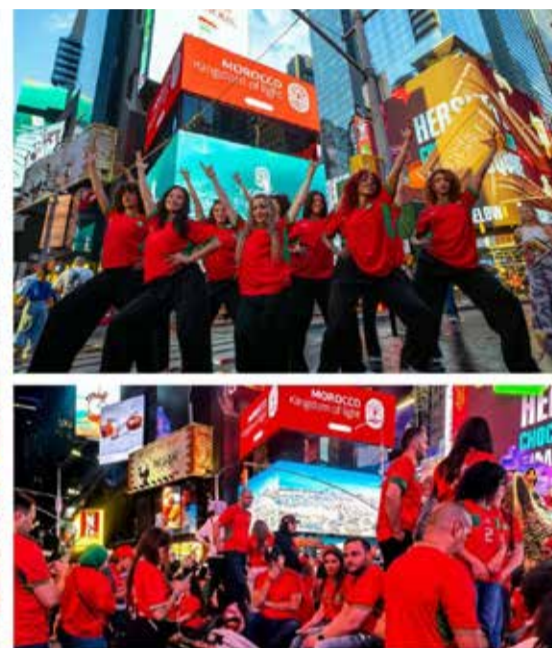
À travers un flashmob mêlant danses traditionnelles, rythmes contemporains et expressions artistiques urbaines, l'ONMT fait vivre un moment d'immersion au cœur de New York.

nérer des contenus à fort potentiel viral relayés par les médias et les créateurs de contenus internationaux.