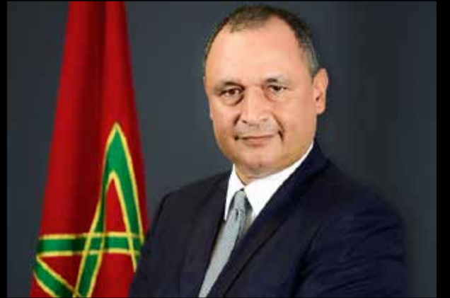
Ryad Mezzour, ministre de l'Industrie et du Commerce.