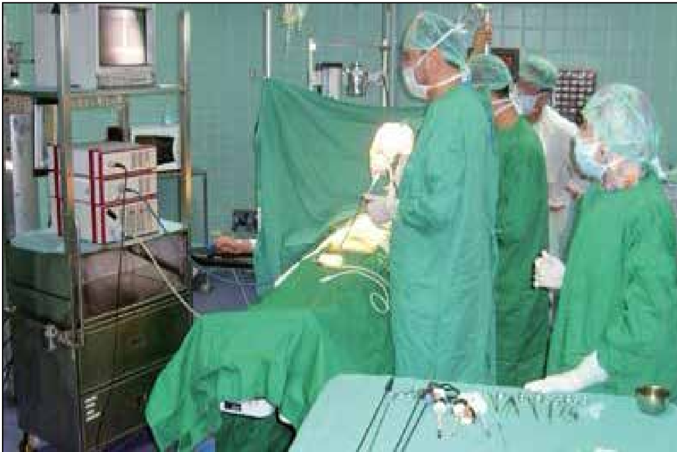
Au-delà des revendications corporatistes, les médecins du secteur privé affirment inscrire leur démarche dans une logique de défense de l'intérêt général.