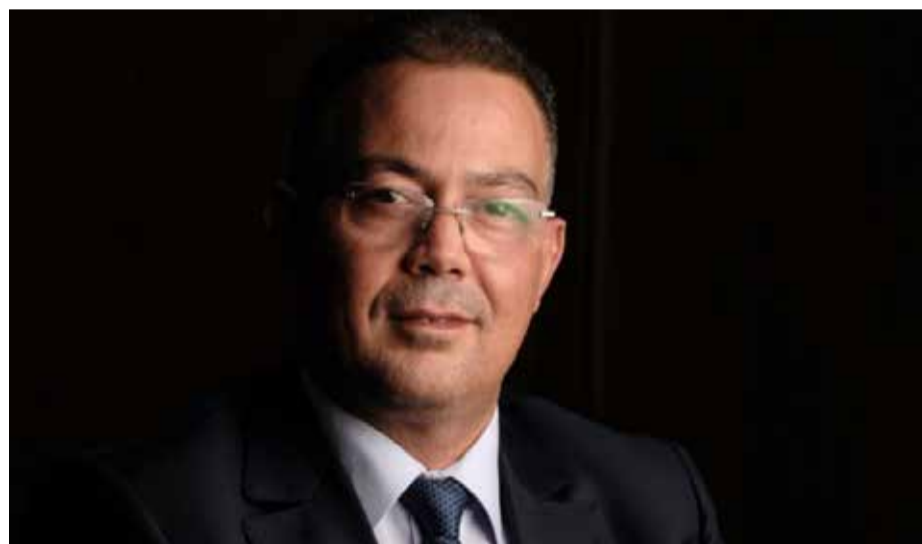
Fouzi Lekjaa. Un destin national ?

Le PAM, qui a été sérieusement ébranlé par des scandales retentissants, dispose certes d'élus, de réseaux territoriaux et d'une forte implantation locale. Mais il lui manque encore une figure susceptible d'incarner une ambition nationale et de mobiliser un électorat au-delà de son socle habi-