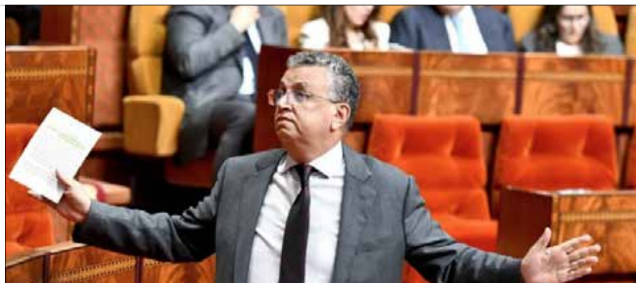
Abdellatif Ouahbi, ministre de la Justice.