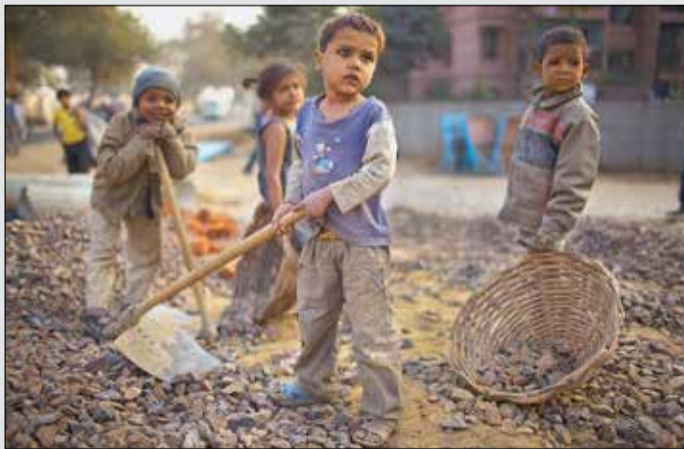
Lorsque l'école perd un élève, le marché du travail gagne souvent une paire de bras.

Autrement dit, lorsque l'école perd un élève, le marché du travail gagne souvent une paire de bras. Le décrochage scolaire reste la principale porte d'entrée vers une vie active prématurée. Une orientation professionnelle forcée qui ne passe ni par un conseiller d'orientation ni par LinkedIn, mais par la précarité économique des familles. Sans surprise, l'agricul-