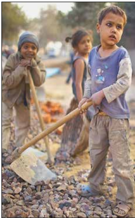
Lorsque l'école perd un élève, le marché du travail gagne souvent une paire de bras.