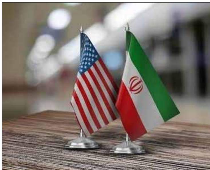
Condamnés à s'entendre...

Même si les détails définitifs du texte n'ont pas encore été rendus publics, l'accord apparaît déjà comme l'un des