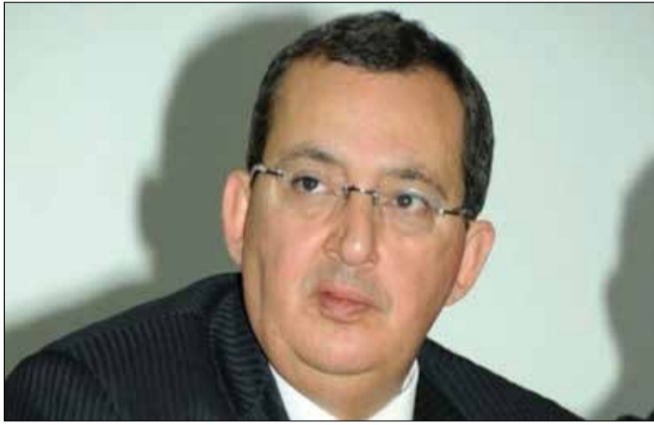
Feu Ali Fassi Fihri.

A li Fassi Fihri, figure marquante de la haute administration, s'est éteint ce dimanche 10 mai 2026 au matin à l'âge de 71 ans. Avec sa disparition, le Maroc perd un haut commis de l'État, un homme de valeur, patriote, serviable et d'une bonhomie rare, apprécié pour sa discrétion, son sens du devoir et ses qualités humaines. Dans un message de condoléances adressé à la famille du défunt, SM le Roi Mohammed VI a salué la mémoire d'un serviteur fidèle et engagé qui a profondément marqué la scène administrative nationale, tout en rappelant le parcours d'un homme de devoir ayant contribué à des décennies de service public. Né le 22 février 1955 à Kénitra, Ali Fassi Fihri, technocrate de formation, a consacré l'essentiel de sa carrière au service public, principalement dans le secteur stratégique de l'énergie. À la tête de l'Office National de l'Électricité et de l'Eau Potable (ONEE), il a piloté durant de longues années des dossiers structurants pour le pays, notamment l'électrification du monde rural dans le cadre du fameux PERG, la fusion des branches de l'eau et de l'électricité en 2011, ainsi que le déploiement de nombreux programmes d'infrastructures énergétiques destinés