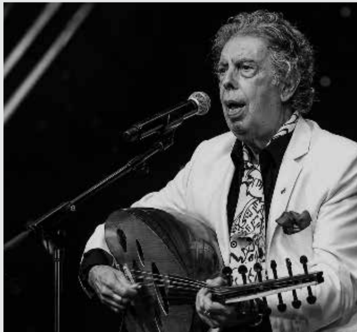
Feu Abdelwahab Doukkali, un virtuose du luth.

Dès le milieu des années 1960, Abdelwahab Doukkali s'impose comme l'une des grandes références de la musique marocaine. Compositeur raffiné et interprète distingué, il a su marier poésie, modernité et enracinement culturel dans des œuvres intemporelles chantées aussi bien en arabe classique qu'en darija. Ses chansons abordaient avec finesse l'amour, les émotions humaines, les transformations sociales et les