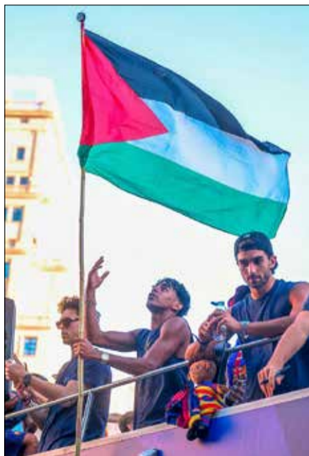
Lamine Yamal a touché les cœurs avec son geste symbolique...