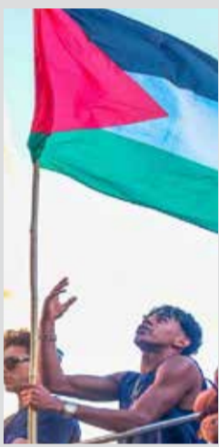
Lamine Yamal a touché les cœurs en brandissant le drapeau palestinien.