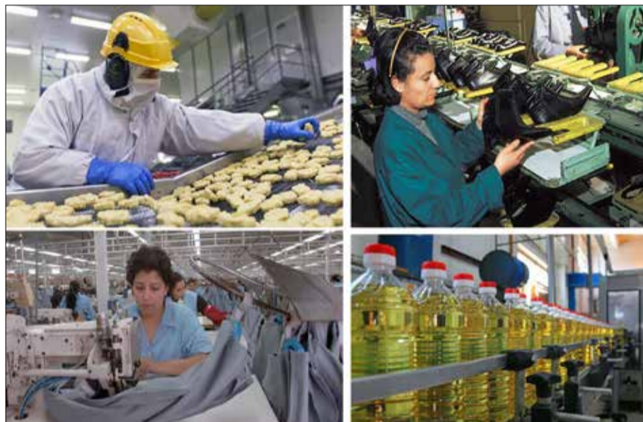
Trois axes structurants s'imposent pour le Maroc : l'énergie, l'industrie et la résilience macroéconomique.

Trois axes structurants s'imposent pour le Maroc : l'énergie, l'industrie, et la résilience macroéconomique. Le premier est évident : réduire la dépendance énergétique. Avec plus de 90 % d'énergie importée, le Maroc est mécaniquement vulnérable. Pourtant, le pays dispose d'un potentiel solaire parmi les plus élevés au monde. Le complexe Noor Ouarzazate, avec une capacité installée de plus de 580 MW, illustre cette ambition. L'objectif national est d'atteindre 52 % de capacité électrique renouvelable d'ici 2030, d'après le Ministère de la Transition Énergétique et du Développement Durable. Cette transition énergétique permettrait au pays de réduire la facture énergétique, de stabiliser les coûts de production et de sécuriser l'approvisionnement. À plus long terme, le Maroc pourrait même envisager l'export d'électricité verte vers l'Europe, dans un contexte de transition énergétique accélérée. Le deuxième axe concerne l'industrialisation. Le Maroc a déjà posé des bases solides. Le secteur automobile représente aujourd'hui plus de 140 milliards de dirhams d'exportations annuelles, d'après l'Office des changes, faisant du pays le premier exportateur vers l'Union européenne hors UE. L'aéronautique, avec plus de 20 000 emplois et environ 20 milliards de dirhams d'exportations, illustre égale-