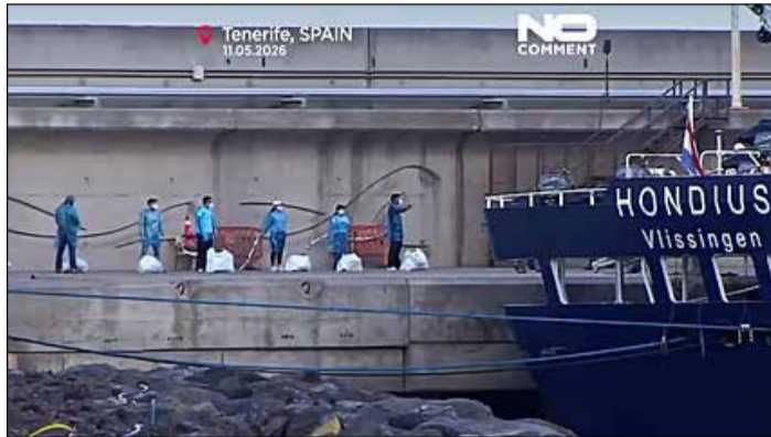
Le Hondius après son arrivée à Tenerife en Espagne.

Mais ce sont surtout les failles potentielles dans le suivi des voyageurs qui inquiètent les observateurs. Sept croisiéristes américains avaient quitté le navire dès le 24 avril sur l'île de Sainte-Hélène, avant même la mise en quarantaine du bateau. Ils ont ensuite rejoint les États-