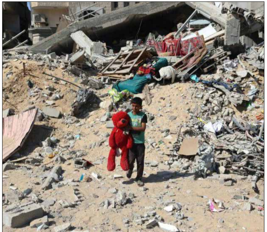
Les massacres des Gazaouis et la destruction de leur ville par les sionistes illustrent parfaitement la connivence occidentale.

Cette perception est renforcée par d'autres épisodes récents. L'interception par l'armée sioniste de militants pro-palestiniens dans les eaux internationales, les conflits oubliés au Soudan, au Congo ou au Mali, ou