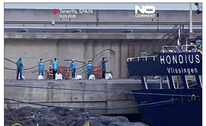
Le Hondious après son arrivée à Tenerife en Espagne.