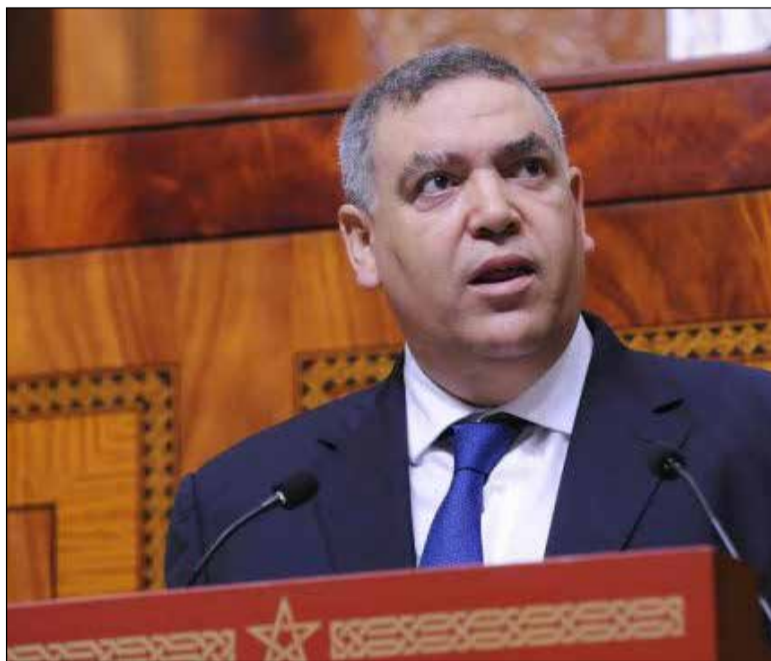
Le ministre de l'Intérieur, Abdelouafi Laftit.

Le détonateur ? La vie chère. Cadeau le plus en vue du gouvernement sortant aux plus vulnérables, ceux-là mêmes qui sont connus pour voter en masse.