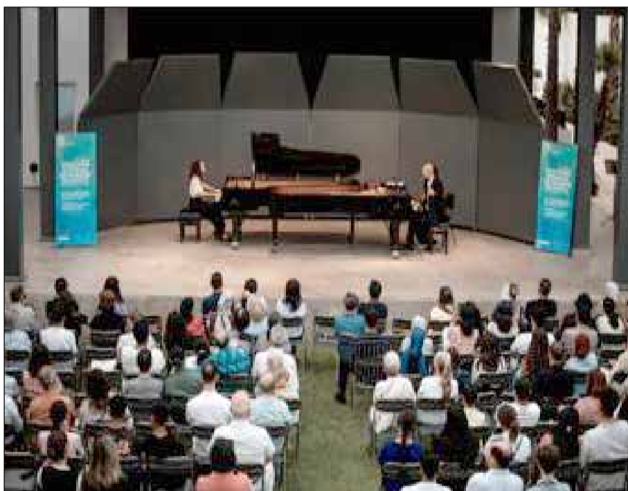
Au-delà de la compétition, le CNMM propose une expérience pédagogique et artistique de haut niveau

ticulièrement à l'honneur le piano, les cordes frottées et la musique de chambre, tout en s'ouvrant, pour la première fois, aux instruments à vent. Le concours est accessible aux candidats âgés de 7 à 30 ans, venus de toutes les régions du Maroc.