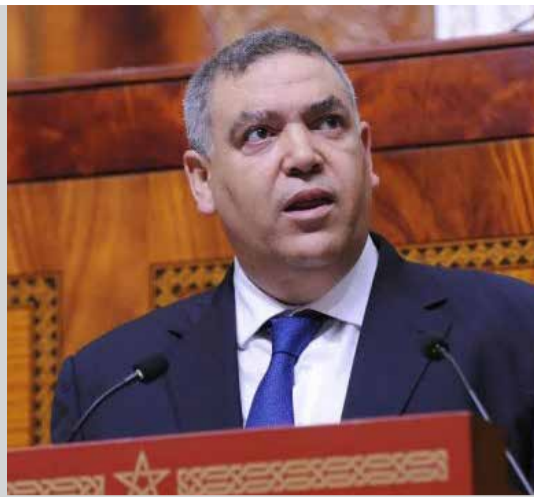
Le ministre de l'Intérieur, Abdelouafi Laftit.