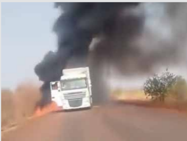
Un camion marocain incendié au Mali par des miliciens.

Un nouvel incident sécuritaire vient raviver les inquiétudes des professionnels marocains du transport international opérant sur les routes reliant le Maroc à l'Afrique subsaharienne. Des vidéos partagées sur le Net montrent des semi-remorques marocains braqués par des milices armées de Kalachnikov qui leur mettent le feu après avoir tiré sur les réservoirs. La scène a eu lieu mercredi matin 6 mai dans la zone frontalière entre la Mauritanie et le Mali. Ces attaques terroristes relancent la question de la sécurité sur les corridors commerciaux traversant le Sahel, une région marquée ces derniers mois par une recrudescence d'actions armées, d'embuscades et d'opérations menées par des groupes jihadistes actifs au Mali et dans les zones frontalières voisines. Le Mali connaît depuis quelques semaines une dégradation de la situation sécuritaire. Plusieurs attaques mystérieuses, imputées par les autorités maliennes à la France et l'Algérie, ont visé des positions militaires, des convois et des infrastructures stratégiques dans différentes régions du pays, illustrant la fragilité du contexte sécuritaire. Cette instabilité grandissante nourrit l'inquiétude des opérateurs économiques et des transporteurs qui empruntent quotidiennement ces axes vitaux pour le commerce régional. Dans un communiqué, l'Union générale des professionnels du transport inter-