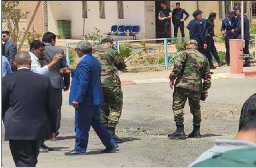
Les autorités locales se sont rendues dans les zones touchées.

Rien de nouveau sous le soleil de Smara. Le Polisario a ses petites habitudes désespérées : fanfaronner, tirer, rater,