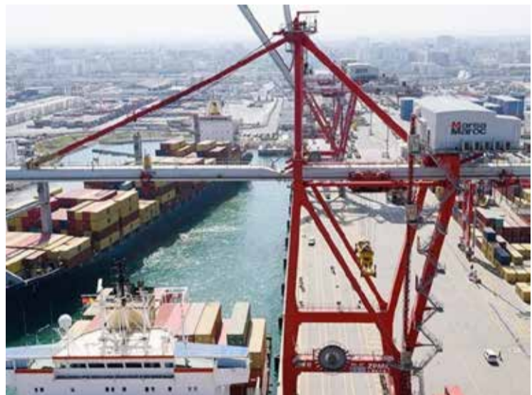
Un blocage pénalisant pour tout le monde.

A u port de Casablanca, ce n'est plus une congestion, c'est une conversion qui ne dit pas son nom qui frappe : on est passé du trafic maritime au trafic... statique. Les navires n'y accostent plus, ils y prennent leur mal en patience. À perte de vue, les coques s'alignent comme des voitures un jour de départ en vacances, sauf qu'ici, la mer ne mène nulle part. Elle tourne en rond, faute de courant. Le spectacle est incroyable : une rade transformée en parking flottant, des files de navires qui s'étirent jusqu'à frôler les abords du Morocco Mall. Le plus grand centre commercial d'Afrique regarde désormais passer... des cargos immobilisés. Ironie du sort : à défaut de faire circuler les marchandises, Casablanca offre une vitrine grandeur nature de ses propres blocages. Du luxe, vraiment. L'exception est devenue la règle. Depuis l'automne 2025, la congestion s'est installée durablement comme un squatteur qu'on n'arrive plus à déloger. Plus de 60 navires en rade aujourd'hui, dont une armada de céréaliers. Résultat : des délais qui dérivent dangereusement ; une dizaine de jours en moyenne, jusqu'à un mois pour certains chargements. Le temps, ici, ne s'écoule plus : il a suspendu son vol ou sa navigation. Et pendant que les bateaux sont en rade, les coûts, eux, prennent le large. Les surestaries s'envolent, atteignant des dizaines de milliers de dollars par jour. Une addition salée qui finit, comme souvent, dans l'assiette du consommateur. Au port de Casablanca, chaque jour