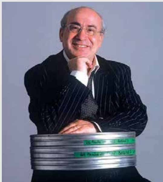
Feu Nabil Lahlou.

L a scène culturelle marocaine perd l'une de ses figures les plus singulières et les plus libres. Le dramaturge, metteur en scène et homme de lettres Nabil Lahlou s'est éteint ce jeudi 7 mai à Rabat, à l'âge de 81 ans, des suites d'une longue maladie. Avec sa disparition, le Maroc perd un immense homme de théâtre, un intellectuel raffiné, un esprit cultivé et profondément humaniste, dont l'œuvre aura marqué plusieurs générations d'artistes et de spectateurs. Nabil Lahlou appartenait à cette catégorie rare de créateurs qui refusent les chemins faciles. Talentueux, érudit, enjoué dans la vie comme dans l'échange, il maniait autant l'humour que la provocation intellectuelle. Derrière son élégance et son sens de la répartie se cachait un homme d'une franchise désarmante, sincère jusqu'à l'inconfort, ce qui lui valut autant d'admirateurs fidèles que d'inimitiés tenaces. Il disait ce qu'il pensait, sans calcul ni complaisance, dans un univers culturel souvent peu tolérant envers les voix indépendantes. Pionnier d'un théâtre marocain audacieux et profondément engagé, il s'est construit en rupture avec le théâtre de divertissement et les recettes faciles du spectacle de consommation. Pour lui, la scène n'était pas un simple lieu d'évasion, mais un espace de questionnement, de confrontation et de lucidité. Son théâtre cherchait