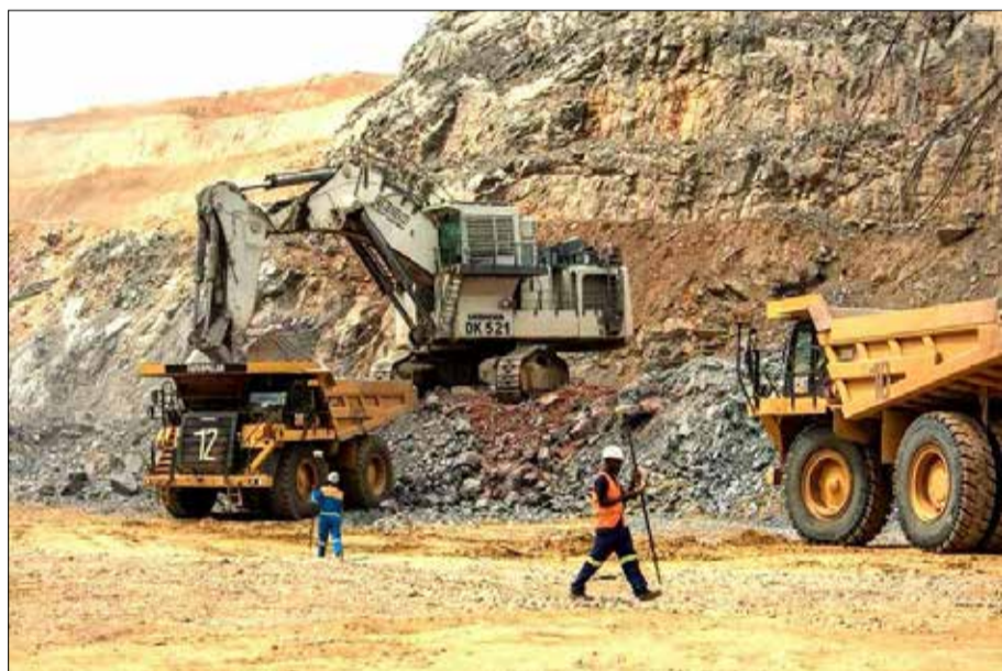
La plupart des économies africaines fonctionnent avec un modèle bancaire hérité de l'époque coloniale.

Pour l'agricultrice de cacao, son récépissé d'entrepôt deviendrait un jeton utilisable comme garantie d'un prêt ou vendable à un acheteur lointain. Pour la petite entreprise, une facture impayée deviendrait une créance numérique cessible en