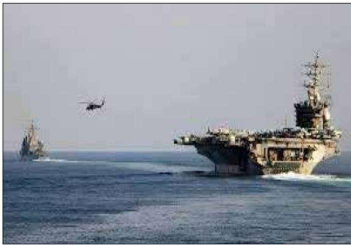
Pour l'Iran, Ormuz reste un levier de pression majeur dans son rapport de force avec les États-Unis.

Le détroit d'Ormuz, artère vitale du commerce énergétique mondial, est redevenu l'épicentre d'une confrontation militaire à bas bruit, où chaque mouvement naval fait grimper la pression géopolitique.