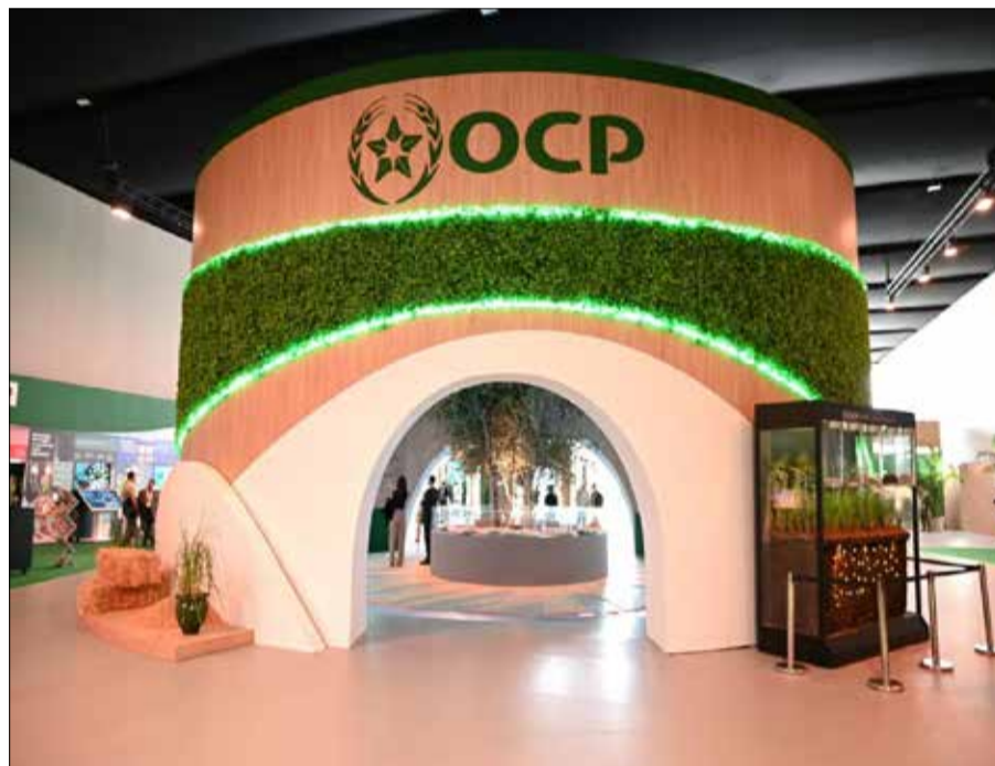
Le stand OCP au SIAM.

Le pavillon du Groupe OCP propose ainsi bien plus qu'une vitrine : une démonstration. Celle d'un modèle où le phosphore devient un fil conducteur