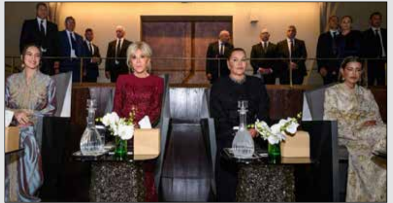
SAR Les princesses Lalla Khadija, Meryem et Hasnaa avec Brigitte Macron.

Les Princesses Lalla Khadija, Lalla Meryem et Lalla Hasnaa, accompagnées de la première dame de France Brigitte Macron, ont assisté dans la soirée du mercredi 22 avril à la soirée d'ouverture du Théâtre Royal de Rabat, marquant une étape majeure dans la dynamique culturelle du Royaume impulsée par le Roi Mohammed VI. Érigé au cœur de la vallée du Bouregreg, cet édifice emblématique incarne l'ambition de positionner Rabat parmi les grandes capitales culturelles internationales et de renforcer le rôle du Maroc comme carrefour de dialogue artistique et civilisationnel.