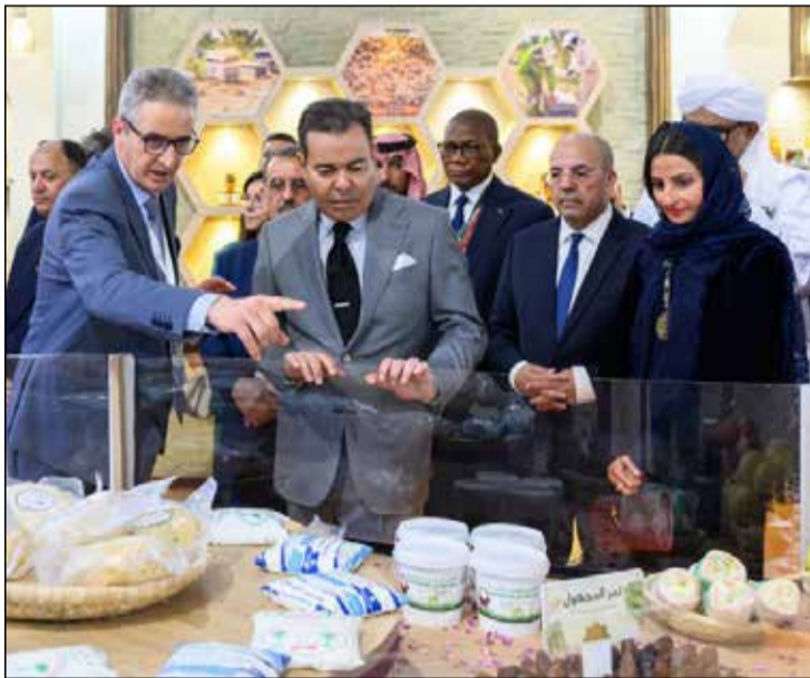
Moulay Rachid lors de la visite d'un stand dédié aux produits du terroir.

Le Prince Moulay Rachid a présidé, lundi 20 avril à Meknès, au Mechouar Stinia-Sahrij Souani, la cérémonie d'ouverture de la 18 e édition du Salon International de l'Agriculture au Maroc (SIAM), organisée sous le Haut Patronage du Roi Mohammed VI, du 20 au 28 avril. Placée sous le thème « Durabilité de la production animale et souveraineté alimentaire », cette édition confirme la place centrale de l'agriculture dans les priorités nationales. La présence du Prince à cet événement traduit l'attention constante accordée par