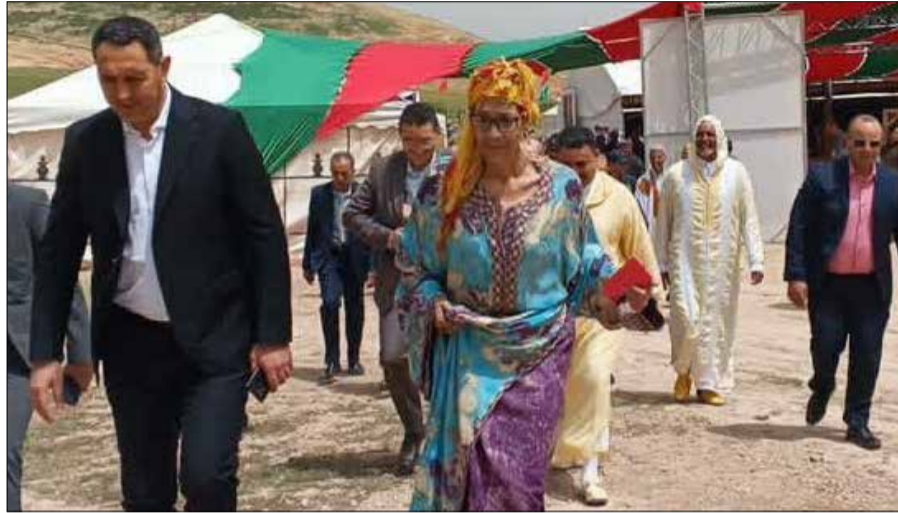
Le gouverneur d'Essaouira lors de son arrivée dans le patelin de Chaabi.