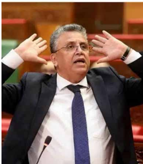
Abdellatif Ouahbi, ministre de la Justice.

Dans un registre complémentaire, Abdellatif Ouahbi est également revenu sur le mécanisme de réduction automatique des peines, introduit dans le cadre