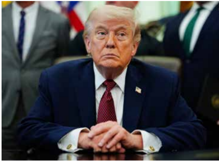
Donald Trump de plus en plus désemparé...

Dans une nouvelle séquence diplomatique à géométrie variable, Donald Trump a décidé de prolonger unilatéralement le cessez-le-feu en Iran, sans fixer de nouveau calendrier ni perspective claire de sortie de crise.