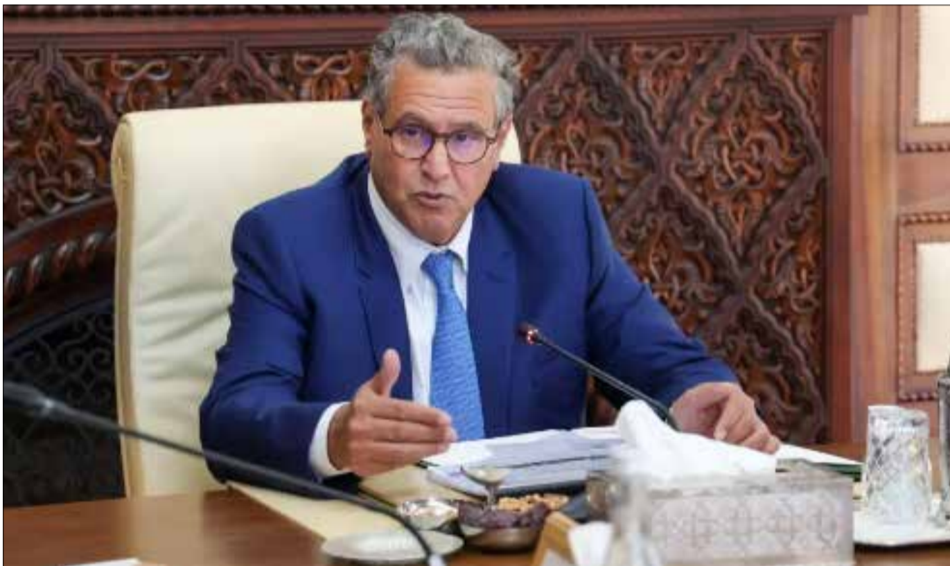
Aziz Akhannouch, chef du gouvernement.

Alors que la vie chère qui a battu tous les records étrangle la population, la session du dialogue social d'avril organisé par l'exécutif a tourné à un exercice d'autosatisfaction gouvernemental.