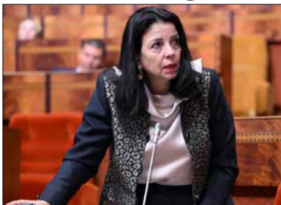
La ministre Amal El Fallah Seghrouchni.

Interrogée sur l'impact négatif du changement d'heure au Maroc, ce fameux GMT qui cristallise le mécontentement croissant de la majorité de la population, Amal El Fallah Seghrouchni a livré une réponse aussi cadrée qu'un cercueil... et aussi évasive qu'un poisson dans l'Atlantique. La ministre déléguée chargée de la Transition numérique et de la Réforme de l'administration a ainsi rappelé que ce dossier est « encadré par des dispositions juridiques et réglementaires » — phrase magique qui signifie généralement : « On a prévu le cadre, mais pas la décision. » Elle a pris soin de souligner que le sujet ne relève ni d'une décision sectorielle isolée ni d'une simple mesure ponctuelle. Autrement dit : « Ne cherchez pas un coupable unique, et surtout, n'attendez pas de moi une réponse claire. » S'exprimant lundi 20 avril lors de la séance hebdomadaire des questions orales à la Chambre des représentants, elle a insisté sur la complexité du sujet, évoquant une évaluation fondée sur « plusieurs paramètres » nécessitant une approche « globale et responsable ». Une formule suffisamment large pour englober à peu près toutes les options... sans en trancher aucune. Entre impératifs économiques et attentes citoyennes, le gouvernement semble surtout cher-