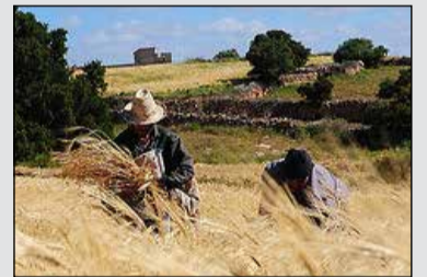
Un nouvel élan pour le secteur agricole.

Portée par des précipitations abondantes et bien réparties sur l'ensemble des régions agricoles, la campagne céréalière au Maroc amorce un net redressement. La superficie emblavée a ainsi atteint près de 3,9 millions d'hectares, traduisant un retour de la confiance