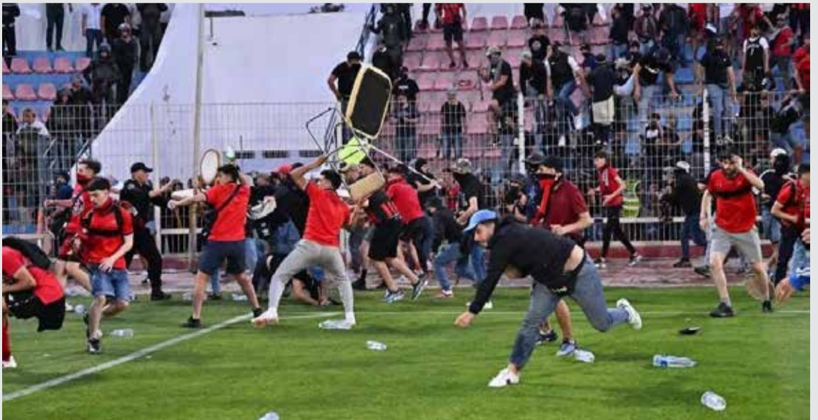
Des supporters algériens se livrant à des actes de violence...

Il y a les dérapages ponctuels, et puis il y a ceux qui, à force de se répéter, finissent par composer une fâcheuse routine. Devinez dans quelle catégorie ranger ce qui s'est passé au Stade El Massira de Safi, dimanche 19 avril, avant la demi-finale retour de la Coupe de la CAF entre l'Olympique de Safi et l'USM Alger ?