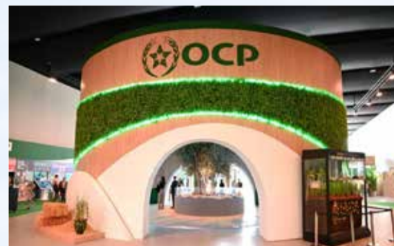
Le stand OCP au SIAM.

COMMENT OCP TRANSFORME LA RESSOURCE EN SOUVERAINETÉ