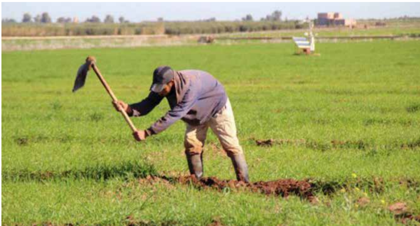
L'économie agricole nationale repose largement sur une main-d'œuvre saisonnière essentielle aux récoltes.