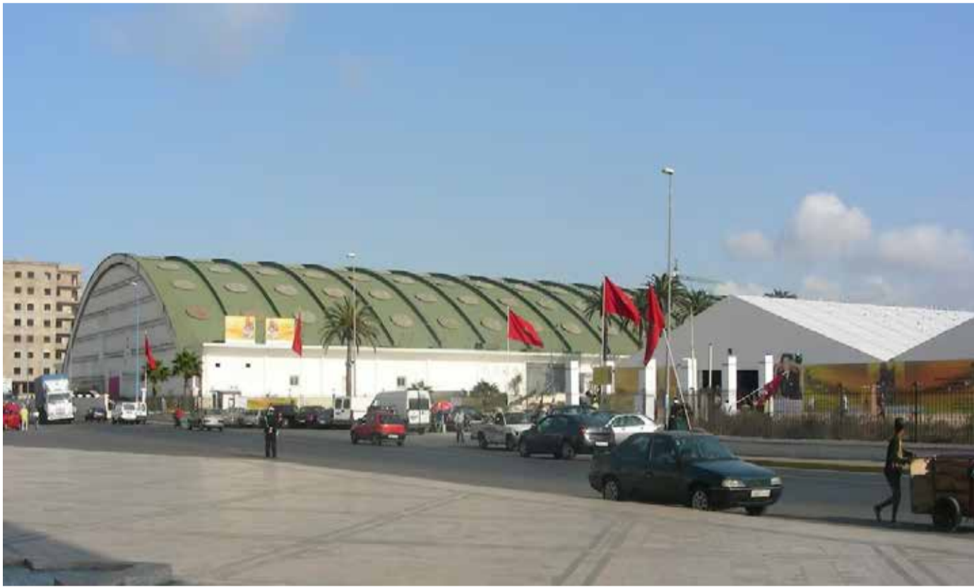
La foire de Casablanca en attendant un hypothétique palais des congrès et des expositions...