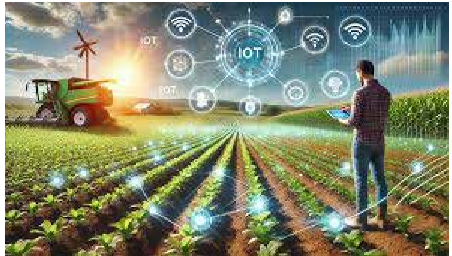
Le Maroc s'inscrit progressivement dans la dynamique de l'agriculture 4.0.

À la croisée de l'innovation technologique et des enjeux agricoles, le Maroc accélère sa transformation digitale pour réinventer son modèle d'élevage. Entre élevage de précision, essor de l'AgriTech et partenariats institutionnels structurants, le Maroc esquisse les contours d'une agriculture plus intelligente, résiliente et tournée vers la souveraineté alimentaire.