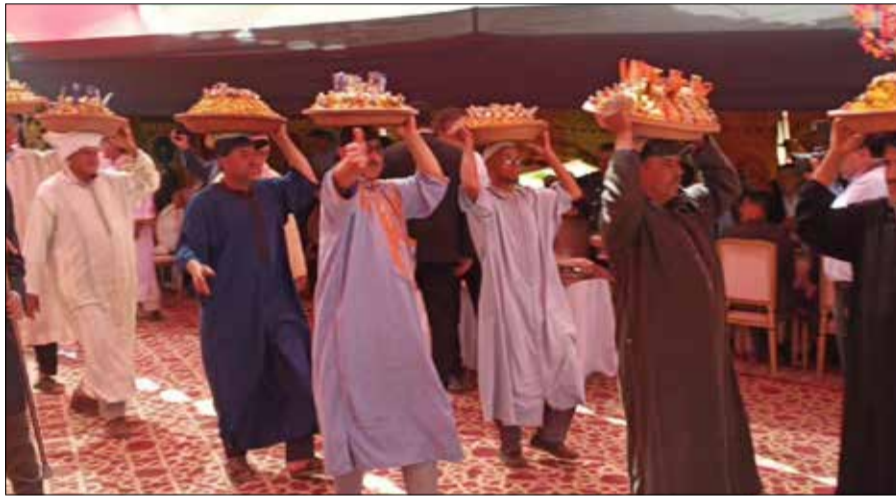
Procession de couscous préparés par les villageois...