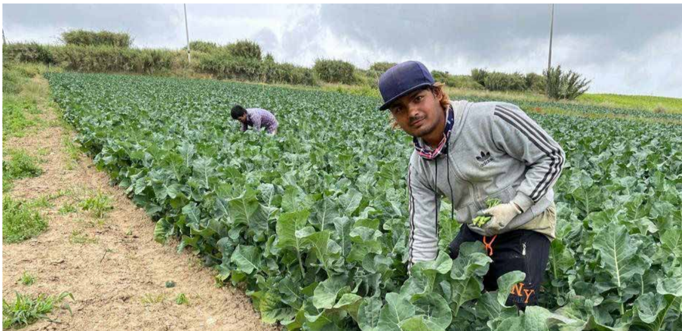
Le Portugal a progressivement tourné la page d'une agriculture extensive peu productive pour s'orienter vers des filières à forte valeur ajoutée.

À première vue, le Portugal ne coche aucune des cases classiques de la puissance agricole. Territoire limité, ressources hydriques sous pression, tissu agricole fragmenté. Et pourtant, à un