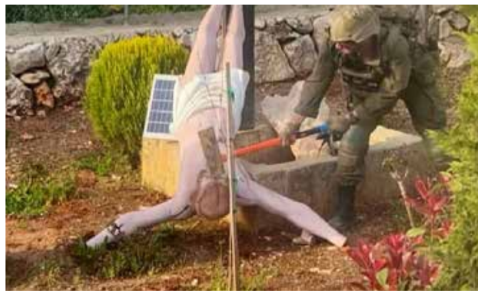
Un soldat israélien saccageant la statue de Jésus Christ...

Officiellement, le message se veut clair : ce type de comportement constitue une entorse grave aux valeurs de l'institution et sera traité « avec la plus grande sévérité ». Une diligence et une fermeté qui tranchent par leur rapidité et leur visibilité. Mais cette réactivité soulève, en creux, une question plus dérangeante. Car si la chaîne de commandement sait se montrer réactive et ferme lorsqu'il s'agit d'une grave atteinte à un symbole religieux, elle reste bien plus souvent passive dans le traitement d'affaires autrement plus graves impliquant les massacres de milliers de civils palestiniens — y compris des journalistes. Dans ces cas,