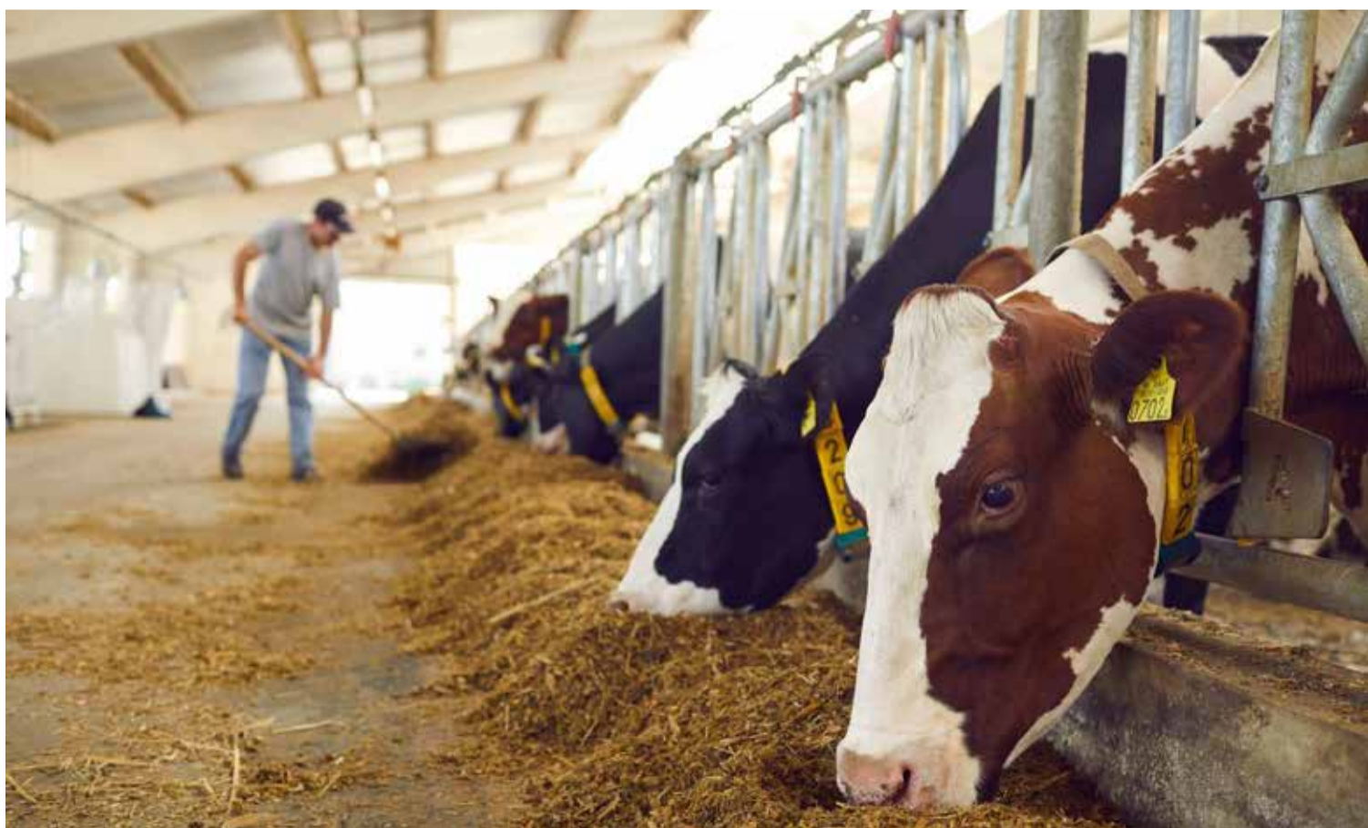
L'élevage marocain repose en grande partie sur des systèmes extensifs, fortement dépendants des aléas climatiques.

Cependant, ces efforts restent insuffisamment connectés aux réalités du terrain. Le transfert de technologie