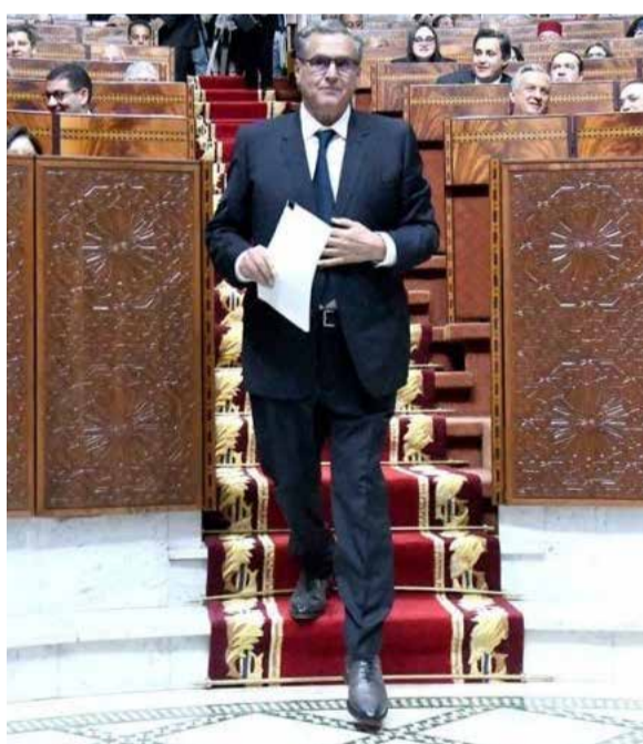
Aziz Akhannouch, un bilan mitigé...

la vie chère ne semble plus relever d'une conjoncture passagère, elle est devenue un ressenti collectif profond, bien enraciné dans le quotidien. Le gouvernement a beau mettre en avant les aides sociales directes, allant de 500 à 1.350 dirhams au profit des familles les plus démunies, force est de constater que dans les faits, ces subventions ont été largement absorbées par la hausse continue des prix. Ce qui est donné d'une main semble repris de l'autre par un marché devenu incontrôlable... À la décharge de l'exécutif, le contexte international est particulièrement rude. Guerre en Ukraine, tensions persistantes au Moyen-Orient, inflation importée : une