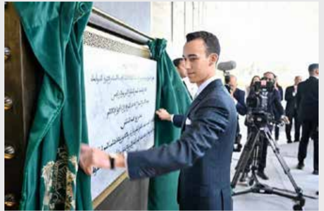
SAR le prince héritier Moulay El Hassan dévoilant la plaque commémorative de la tour.