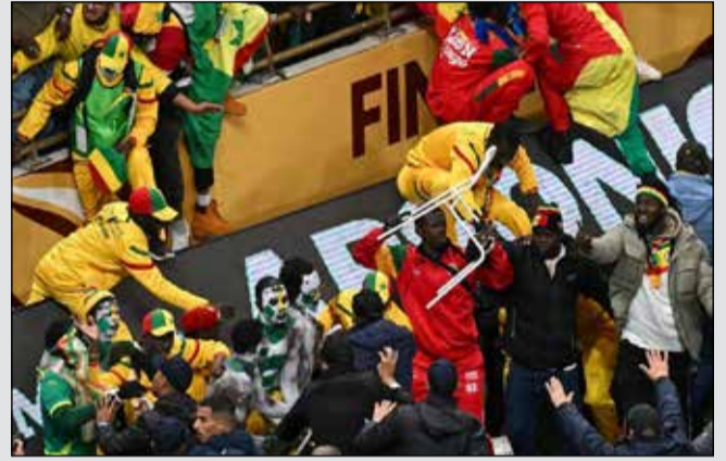
Des scènes qui ont perturbé le bon déroulement de la finale et qui ont été largement relayées sur les réseaux sociaux.

DANS LE SPORT, LE CORPS ET L'ESPRIT FONT ÉQUIPE POUR NOTRE BIEN-ÊTRE