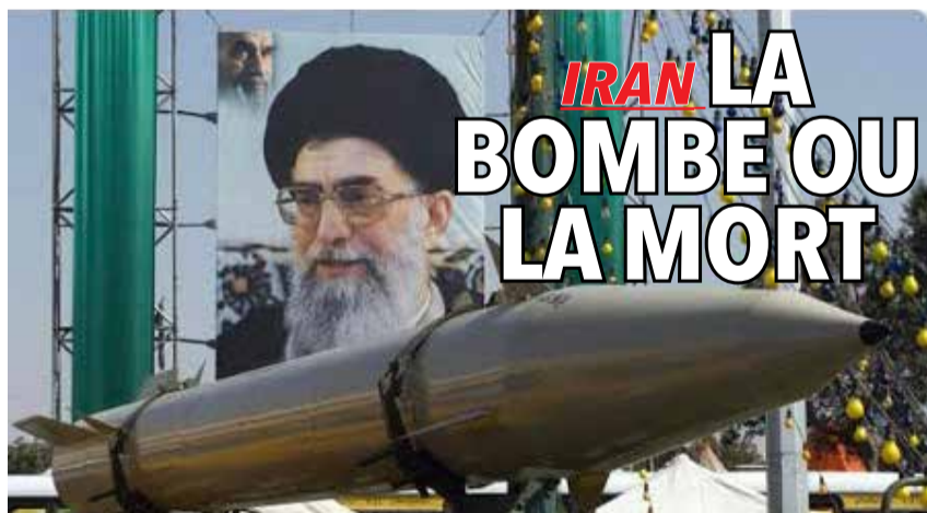
À Téhéran, l'idée gagne du terrain que la retenue n'a pas protégé le pays, bien au contraire.