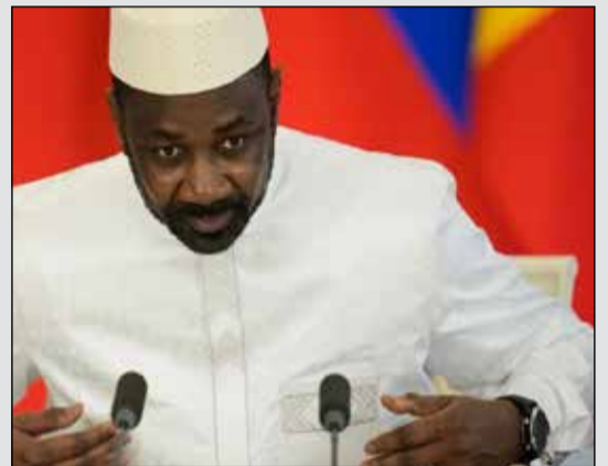
Le président du Mali Assimi Goïta.

L a République du Mali a annoncé, jeudi 9 avril, le retrait officiel de sa reconnaissance de la prétendue "République Arabe Sahraouie Démocratique" (rasd), après réexamen approfondi du dossier du Sahara, considéré par Bamako comme un enjeu majeur pour la paix et la stabilité sous-régionales. Cette position a été exprimée dans une déclaration officielle du gouvernement malien, lue par Abdoulaye Diop, à l'issue de sa rencontre avec le ministre marocain