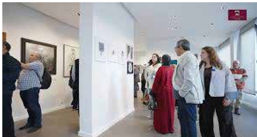
À travers « Traces sur Rivages », le public découvre des œuvres qui reflètent la pluralité des regards.

Cette exposition met à l'honneur une sélection d'œuvres issues de la collection de la Fondation Hassan II pour les Maro-