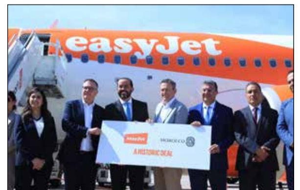
Cette implantation s'accompagne de six nouvelles lignes.

Cette implantation s'accompagne de six nouvelles lignes et du renforcement de plusieurs dessertes existantes, portant à 58 le nombre total de routes vers le Royaume. easyJet étend ainsi son réseau à cinq aéroports marocains, tout en consolidant sa position sur des marchés clés comme le Royaume-Uni et la Suisse. Au-delà du transport, la base générera une centaine d'emplois directs et dynamisera l'écosystème touristique local. Elle s'inscrit dans un partenariat stratégique lancé en 2025, visant à soutenir une croissance touristique durable et mieux structurée. ▀