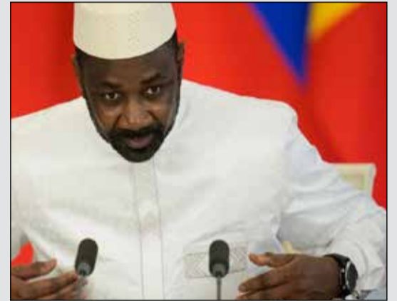
Le président du Mali Assimi Goïta.

L a République du Mali a annoncé, jeudi 9 avril, le retrait officiel de sa reconnaissance de la prétendue "République Arabe Sahraouie Démocratique" (rasd), après réexamen approfondi du dossier du Sahara, considéré par Bamako comme un enjeu majeur pour la paix et la stabilité sous-régionales. Cette position a été exprimée dans une déclaration officielle du gouvernement malien, lue par Abdoulaye Diop, à l'issue de sa rencontre avec le ministre marocain