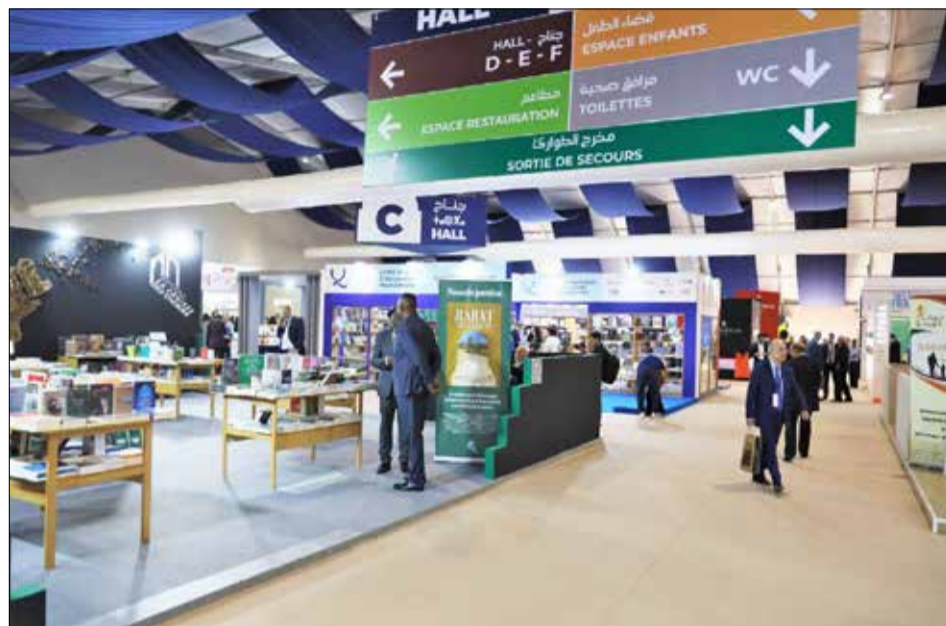
Le SIEL 2026 réunira de grands noms de la littérature française.