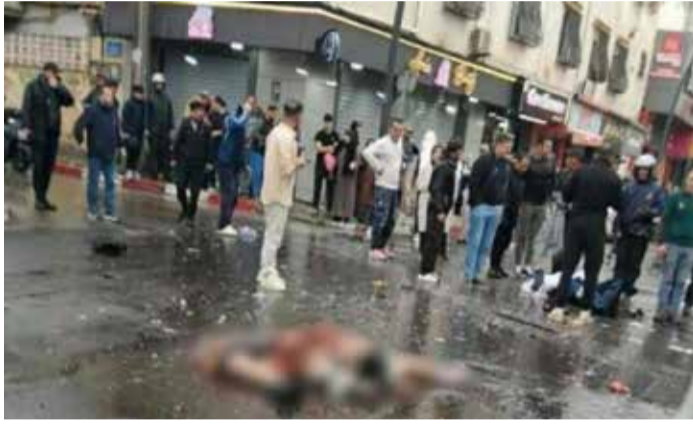
Les deux terroristes ont été tués sur le coup, tandis qu'un policier aurait été blessé lors de l'intervention.

Les policiers présents auraient réagi rapidement. Les deux terroristes ont été tués sur le coup, tandis qu'un policier aurait été blessé lors de l'intervention. Selon Le Monde, les deux présumés terroristes auraient activé leur ceinture un peu trop tôt, après avoir été repérés par un policier en faction. Panique, bouton appuyé par erreur, et boum ! Le problème n'est pas tant l'attentat lui-même – après tout, ça arrive même aux meilleurs – mais le silence assourdissant qui l'entoure. Les médias algériens ? Muets comme des carpes. Le gouvernement ? Pas un communiqué, pas un mot, pas une phrase pour rassurer. Rien. Comme si ignorer un attentat le ferait disparaître. Une technique de gestion de crise digne d'une autruche sous amphétamines. Pendant ce temps, le pape continue sa visite sous haute sécurité – très haute, même, puisque les terroristes n'ont même pas réussi à s'approcher d'une cible. Mais l'image, elle, est là, ravageuse : l'Algérie, ce pays que le régime anachronique et aux abois voulait présenter comme un havre de paix religieuse et de stabilité à