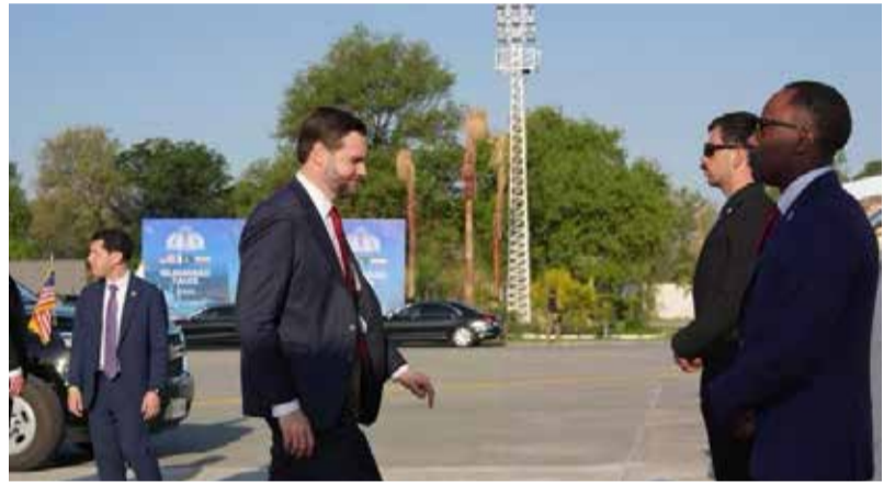
JD Vance revient bredouille à Washington.