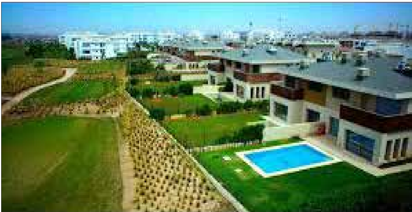
Les habitants se mobilisent pour empêcher l'extension des dérives...

Pensée comme une oasis résidentielle aux portes de Casablanca, la Ville Verte de Bouskoura promettait calme, nature et qualité de vie. Une quinzaine d'années années plus tard, le décor a changé. Dans le mauvais sens. Explications.