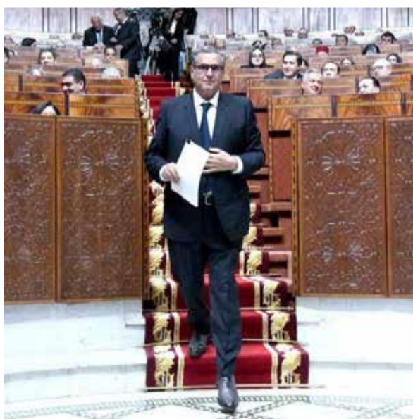
Aziz Akhannouch, un bilan mitigé...

Beurgeois.Gentleman@gmail.com Retrouver les anciens épisodes en version électronique sur notre site web www.lecanardlibere.com