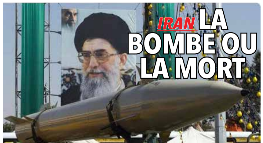
À Téhéran, l'idée gagne du terrain que la retenue n'a pas protégé le pays, bien au contraire.