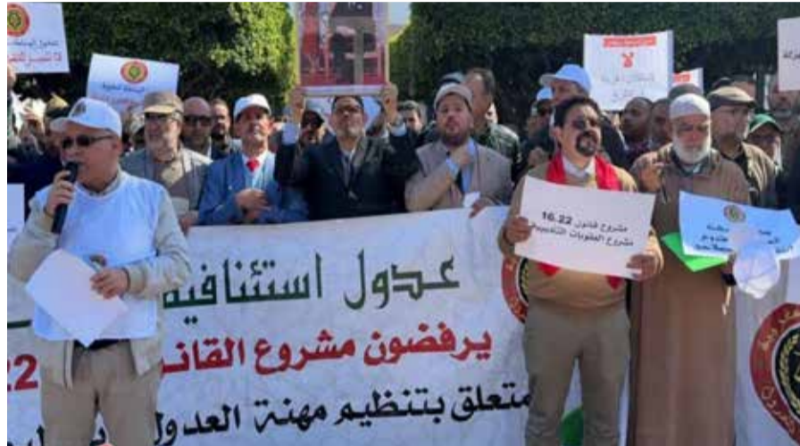
Les contestataires dénoncent un texte qui instaure une remise en cause profonde du métier, qui va l'encontre des intérêts des adouls.

Par ailleurs, l'Instance nationale des adouls a annoncé une suspension totale des services professionnels à par-