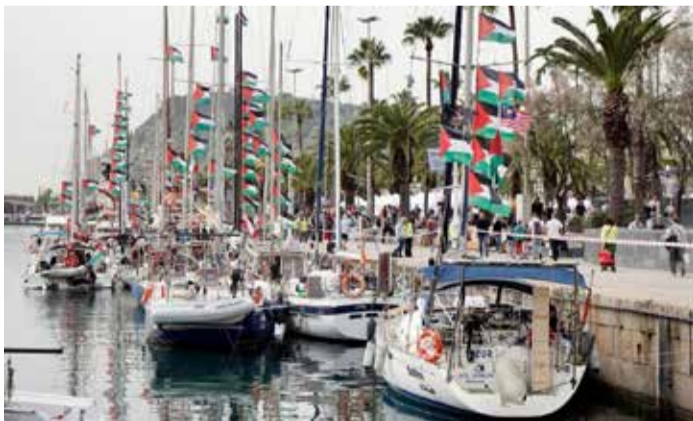
Cette nouvelle mission s'inscrit dans la continuité d'une précédente expédition menée à l'automne 2025.

bateaux partis de Marseille le 4 avril doivent le rejoindre, tandis que d'autres embarcations sont attendues depuis Syracuse, en Sicile, à partir du 24 avril. Une escale d'une semaine est par ailleurs programmée dans le sud de l'Italie pour une formation à la non-violence, avant de poursuivre la traversée. Au total, des centaines de participants issus de dizaines de pays sont attendus. Cette nouvelle mission s'inscrit dans la continuité d'une précédente expédition menée à l'automne 2025, qui avait suscité une vive attention internationale. La flottille, alors composée d'une cinquantaine de navires, avait été interceptée par le colonisateur israélien au large des côtes égyptiennes et de Gaza début octobre. L'opération, dénoncée comme illégale par ses organisateurs et par Amnesty International,