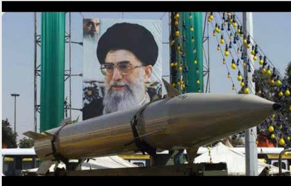
À Téhéran, l'idée gagne du terrain que la retenue n'a pas protégé le pays, bien au contraire.

à ses visées expansionnistes au nom du "Grand Israël". Pour les stratèges iraniens, renoncer dans ces conditions aux programmes nucléaire et balistique reviendrait à accepter un déséquilibre irréversible, voire une forme de vulnérabilité stratégique comparable à celle des États du Golfe: prospères, certes, mais dépendants de parapluies sécuritaires étrangers. Or, cette perspective est inacceptable pour un régime qui ne fait pas confiance ni à Israël de Netanyahu ni aux États-Unis de Trump. Accepter de devenir un acteur sans capacité de dissuasion autonome équivaldrait à une capitulation idéologique autant que militaire. L'arme nucléaire, dans cette grille de lecture, n'est pas un luxe ni un symbole de puissance, mais un outil de survie dans un jeu régional où les règles sont dictées par la force. Le virage iranien