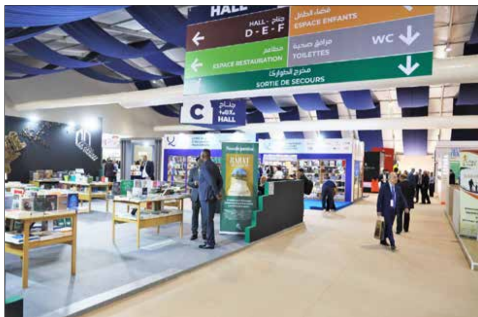
Le SIEL 2026 réunira de grands noms de la littérature française.