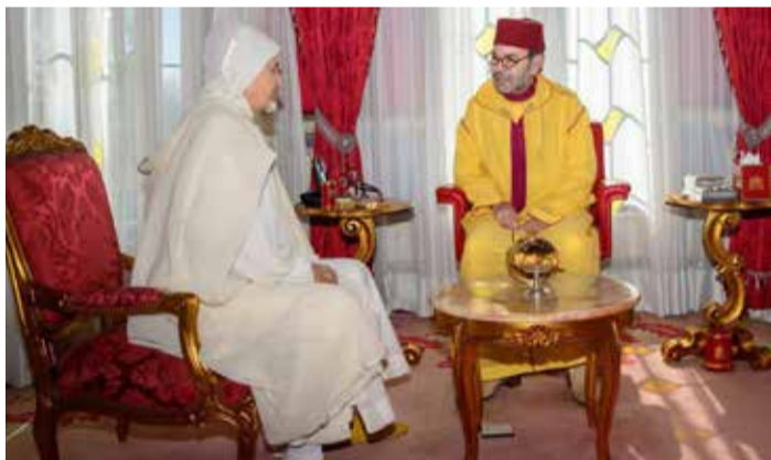
Le souverain recevant El Yazid Er-Radi.

L e Roi Mohammed VI, Commandeur des Croyants, a procédé ce mardi 14 avril 2026 à la nomination de El Yazid Er-Radi au poste de secrétaire général du Conseil supérieur des Oulémas.