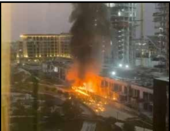
Un immeuble en feu à Dubaï après la chute d'un missile...