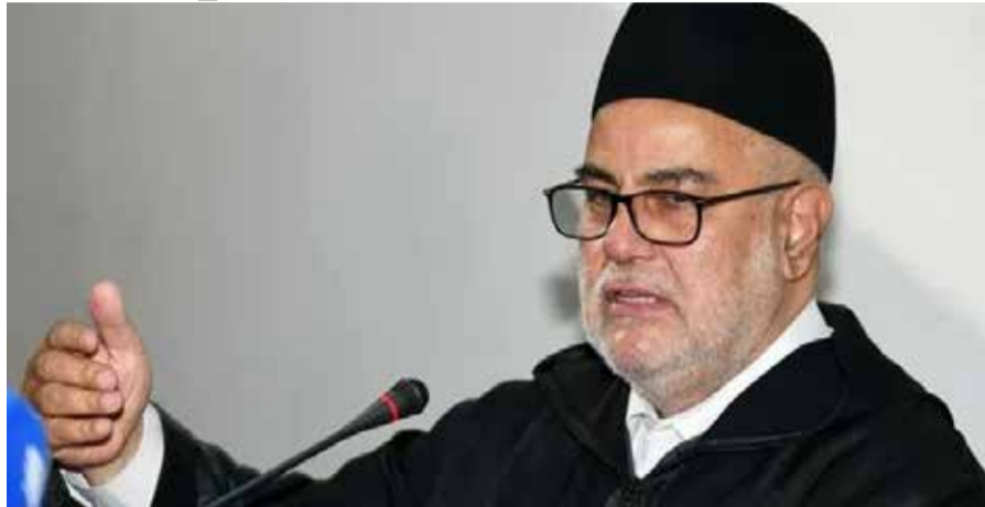
Le secrétaire général du PJD, Abdelilah Benkirane.

Mais le patron du PJD ne s'arrête pas là. Dans la foulée, il s'engage aussi à supprimer le plafonnement de l'âge pour accéder à la fonction publique, un clin