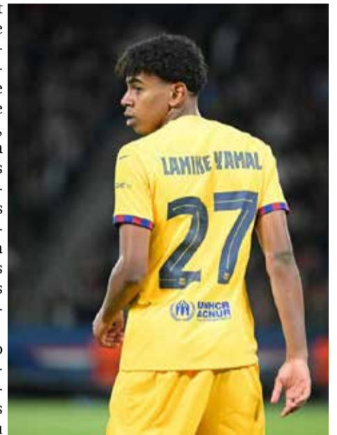
Lamine Yamal avait déjà été la cible de chants islamophobes émanant d'une partie du public espagnol.