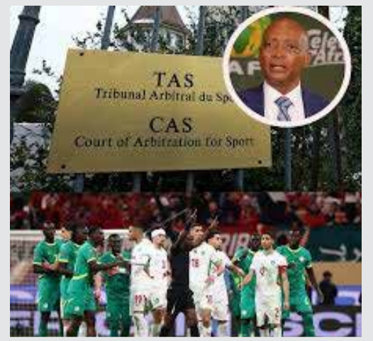
Le verdict du TAS est attendu comme un couperet.