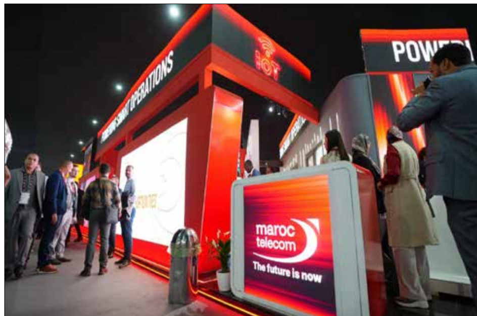
Sur son stand, Maroc Telecom propose une immersion complète dans son écosystème technologique.

localement dans un environnement sécurisé et conforme aux exigences de souveraineté numérique. À cela s'ajoutent des solutions avancées de gestion de l'IoT, offrant un pilotage en temps réel des objets connectés, avec des applications concrètes dans l'industrie, la logistique ou les services urbains. Le volet cloud et intelligence artificielle, porté notamment par Casanet, met en avant des solutions de cybersécurité, de transformation cloud et d'intégration de l'IA dans les usages métiers, avec des technologies comme Microsoft Azure et Microsoft 365 enrichi par Copilot. Côté fintech, les filiales Moov Africa valorisent leur solution Moov Money, à travers une borne immersive permettant de découvrir un large éventail de services: paiement mobile, nano-crédit, cartes prépayées et solutions digitales innovantes. La démonstration de la SuperApp Moov Money illustre également l'évolution vers une plateforme tout-en-un, pensée pour simplifier l'expérience utilisateur. Le Groupe met également en avant les innovations de ses filiales africaines, notamment à travers des contenus interactifs et des cas d'usage concrets. Parmi eux, la solution MIA (Moov Intelligence Artificielle), développée au Bénin, se distingue comme un assistant vocal intelligent capable de répondre en temps réel en plusieurs langues, y compris locales. Enfin, plusieurs démonstrations illustrent le potentiel des technologies de pointe, notamment la 5G appliquée à l'industrie intelligente