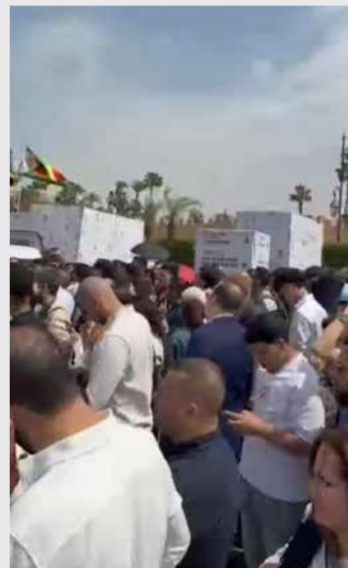
Une longue attente sous un soleil de plomb...

GITEX Marrakech a tenu ses promesses mais à sa manière. Il a prouvé que le futur n'est pas toujours là où on l'expose. Parfois, il reste coincé pendant de longues heures à l'entrée... derrière un badge. ▶