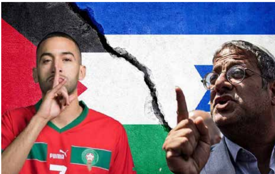
Ziyech a marqué un beau but contre les bourreaux des Palestiniens...

L'international marocain Hakim Ziyech et le ministre israélien de la Sécurité nationale l'extrémiste Itamar Ben-Gvir se sont livrés à un échange particulièrement tendu sur Instagram, dans un contexte politique explosif au Moyen-Orient. Éloigné des terrains en raison d'une blessure musculaire avec le Wydad Casablanca, le joueur a pris position sur les réseaux sociaux pour dénoncer une décision scandaleuse de la Knesset.