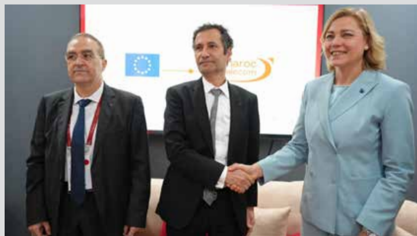
Poignée de main entre Mohamed Benchaaboun et Henna Virkkunen.

Les discussions ont porté sur la sécurisation des infrastructures, la gouvernance des données et la cybersécurité, dans un contexte où l'Europe et l'Afrique partagent des défis communs face aux menaces