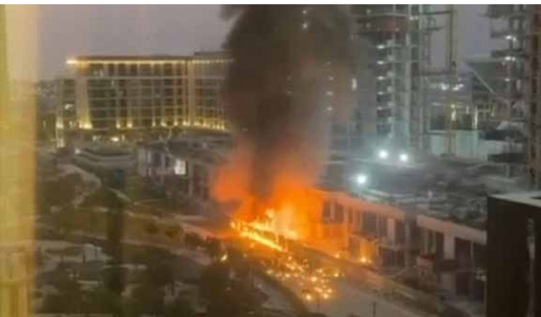
Un immeuble en feu à Dubaï après la chute d'un missile...

Dans ce théâtre parfaitement réglé, les autorités ne se contentent pas de surveiller : elles montent aussi au montage. Images supprimées, contenus bloqués, panique effacée. La guerre, oui... mais