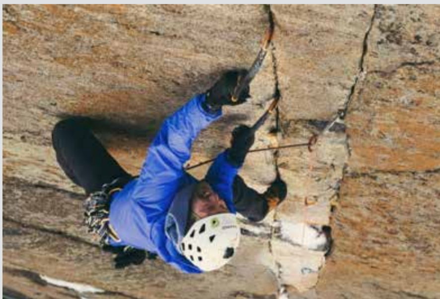
Yvon Chouinard escaladant, sans geindre, une paroi dans le parc national de Yosemite (Sierra Nevada). Pour en savoir plus sur la société Patagonia, visiter son site web : https://eu.patagonia.com/fr/fr/stories/

Le verbe « chouiner » veut dire pleurnicher, geindre, se plaindre de son sort, se lamenter... Un chouinard, c'est un homme pleurnichard. Yvon Chouinard ne porte pas bien son nom car il a une belle âme. Cet homme a créé « Patagonia », l'une des plus grandes entreprises de vêtements sportifs, d'une valeur estimée à 30 milliards de MAD – dirhams marocains. Né aux USA en 1938 dans une famille franco-canadienne, il se passionne pour l'escalade dès l'âge de 14 ans. Adulte, il juge que les pitons qu'il utilise ne sont pas assez solides et décide de les fabriquer lui-même. Devenu milliardaire, Yvon Chouinard ne pleurniche pas : il rit en montrant les manches usées de sa vieille chemise : « Je ne suis pas un adepte de la consommation ». C'est surprenant de la part d'un patron d'une entreprise au chiffre d'affaires annuel de 10 milliards de MAD : « J'ai ce qu'il faut pour vivre ! Je n'en attends rien de plus ». En 2022, il cède sa société « Patagonia », évaluée à 30 milliards MAD, allouant 2 % des actions à un trust pour que les bénéfices servent à des actions sociales, et les 98 % restants à l'organisation Holdfast Collective, chargée de défendre des causes environnementales. Pour celui qui a fait de l'escalade sur tous les continents, le sport est ce qui lui manque le plus aujourd'hui car à 88 ans, il n'a plus le sens de l'équilibre. Pour autant, sa connexion viscérale à la nature lui a permis de comprendre il y a longtemps les changements irréparables infligés par l'homme à