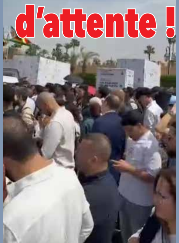
Une longue attente sous un soleil de plomb...