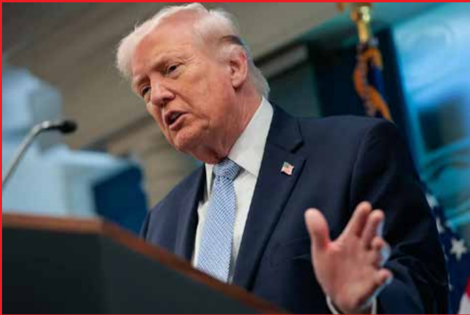
Le président américain Donald Trump.