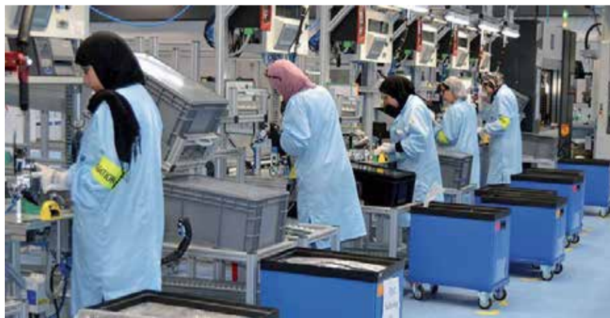
Derrière cette hécatombe, une réalité structurelle : jusqu'à 70% des TPE ne dépassent pas les cinq premières années d'activité.

L e constat est sévère et sans détour : au Maroc, le problème n'est pas de créer des entreprises, mais de les faire survivre. Dans son rapport de mars 2026, la Confédération marocaine des TPE-PME décrit un tissu économique dominé par des structures fragiles, où les très petites entreprises (97% du total) peinent à accéder aux ressources essentielles pour durer : financement, marchés, accompagnement et transformation numérique. Les chiffres donnent la mesure de la crise. Près de 150.000 entreprises ont disparu entre 2022 et 2025, dont l'écrasante majorité de TPE. Les défaillances ont plus que doublé en quatre ans, au point qu'en 2025, une entreprise fermait toutes les dix minutes. Derrière cette hécatombe, une réalité structurelle : jusqu'à 70% des TPE ne dépassent pas les cinq premières années d'activité. Au cœur du problème, l'accès au financement reste verrouillé. Moins de 5% des TPE bénéficient d'un crédit bancaire, freinées par des exigences inadéquates à leur taille (garanties, comptabilité formelle, historique financier). Cette exclusion alimente un cercle vicieux : faute d'alternatives, une large part des TPE bascule dans l'informel — un secteur qui concernerait environ 41% d'entre elles. Loin d'être un choix opportuniste, cette informalité apparaît comme une stratégie de survie