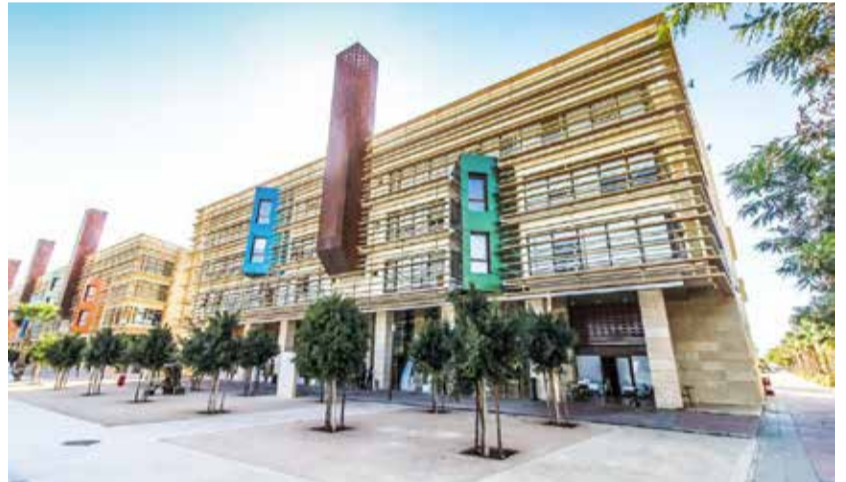
1337 a décroché le sacre face à des institutions de référence...

Derrière ce sacre, il n'y a pas un simple coup d'éclat, mais un véritable processus d'apprentissage et d'excellence. Cette première place est le fruit : d'heures intensives de pratique et d'expérimentation, d'échecs transformés en leviers de progression et d'itérations constantes et d'amélioration continue. Elle reflète pleinement l'ADN du modèle pédagogique de 1337, fondé sur l'apprentissage en faisant progresser par les pairs (peer-learning) et repousser ses propres limites.