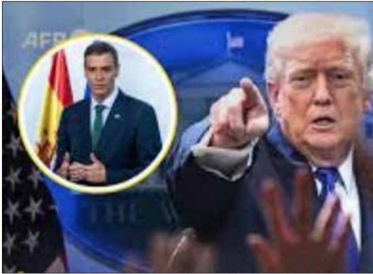
Pedro Sán chez assume une ligne de rupture courageuse face à Donald Trump.

L'Espagne de Pedro Sanchez hausse le ton et ne fait plus semblant. Après avoir déjà interdit début mars l'accès des bases andalouses de Rota et Morón aux forces américaines, Madrid franchit un nouveau cap : son espace aérien est désormais fermé à toute opération liée à l'offensive contre l'Iran. Le message est limpide. Sous la bannière du « Non à la guerre », le chef du gouvernement Pedro Sánchez assume une ligne de rupture courageuse face à Donald Trump et à la guerre israélo-américaine au Moyen-Orient. Pour Madrid, la logique est implacable : aucun avion participant, de près ou de loin, à cette guerre injuste et illégale ne sera autorisé à survoler le territoire espagnol. Une position appuyée par le vice-président Carlos Cuelpo, qui dénonce un « acte unilatéral » contraire au droit international. Concrètement, la décision va bien au-delà des bases militaires. Non seulement les appareils américains ne peuvent