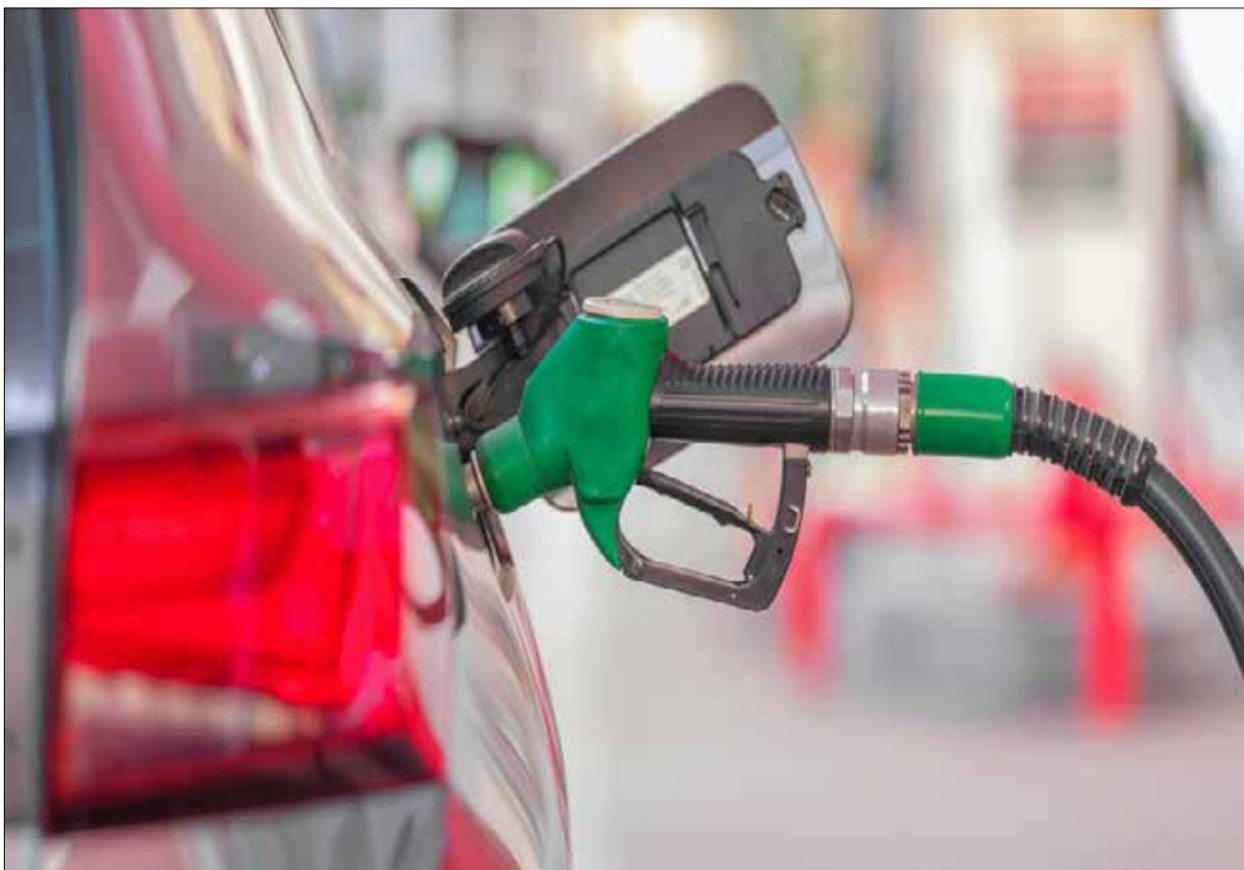
La Fédération pointe des profits « astronomiques ».

Une liberté qui sent bon le mirage. Conséquence logique : rideau baissé pour de nombreuses stations, faute de carburant. Et pendant que le service public cale, les distributeurs, eux, semblent rouler tranquille, sans se presser pour approvisionner. Une inertie qui soulève plus d'un capot : lenteur justifiée ... ou stratégie bien huilée ? Pour la Fédération, pas de