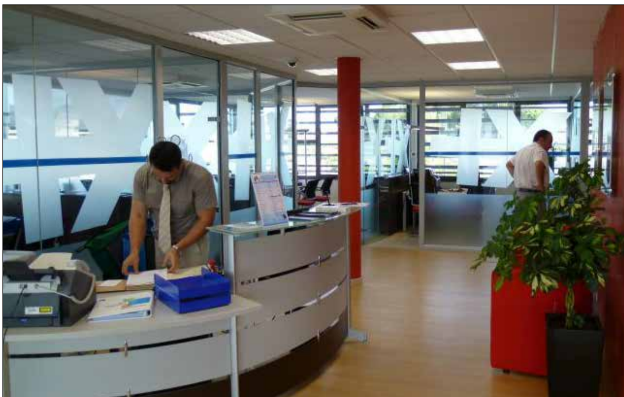
Le Maroc dispose d'un écosystème en croissance, d'un cadre réglementaire en évolution et d'acteurs bancaires solides.

Le secteur bancaire marocain est à un tournant. Longtemps structuré autour d'un modèle classique fondé sur les agences, le crédit et la relation client physique, il est aujourd'hui bousculé par une double pression : l'accélération du digital et l'émergence de nouveaux acteurs, les fintechs.