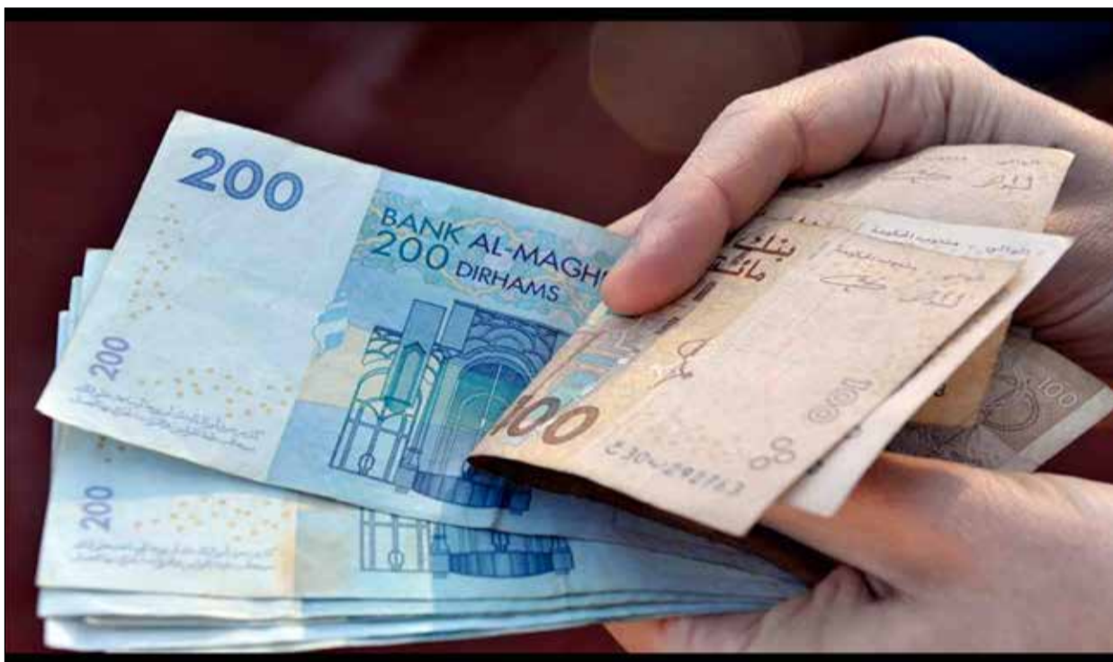
Les paiements en espèces continuent de dominer une large partie des transactions, notamment dans les petits commerces et l'économie informelle.

Au Maroc, l'extension de l'accès aux services ban-