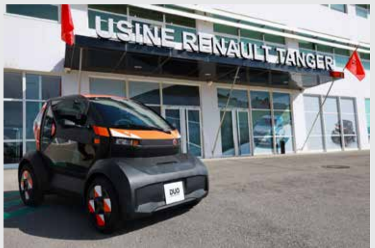
Renault Tanger a annoncé un plan de licenciement de 850 cadres !

Face à ces transformations profondes, le mutisme du gouvernement est pour le moins étonnant. Pas de débat à la hauteur des enjeux. Peu de prises de parole fortes. Une forme de résignation silencieuse. C'est peut-être le signal le plus alarmant. Car ce qui se joue derrière ces suppressions d'emplois n'est pas une simple adaptation économique, mais une mutation structurelle aux conséquences sociales