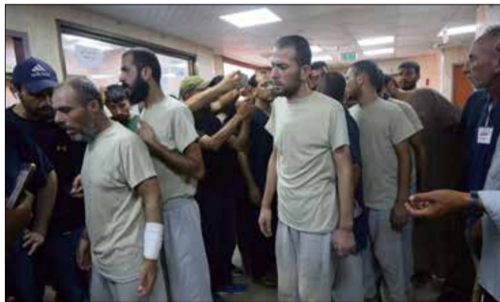
La peine de mort a été instaurée uniquement pour les Palestiniens!

Cette décision a immédiatement suscité de vives réactions du côté palestinien. Le Ministère des Affaires étrangères palestinien a dénoncé « un crime » et « une escalade dangereuse », estimant que cette législation vise à donner une apparence légale à des exécutions extrajudiciaires. De son côté, le mouvement Hamas a condamné une loi qui, selon lui, reflète une logique de violence et remet en cause les principes fondamentaux du droit international. Cette loi a aussi été dénoncée par plusieurs organisations internationales dont le Conseil de l'Europe. Alain Berset, secrétaire général de l'institution, a estimé que la peine de mort est un "anachronisme juridique