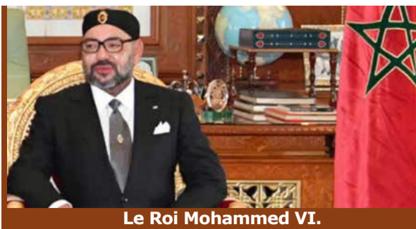
Le Roi Mohammed VI.