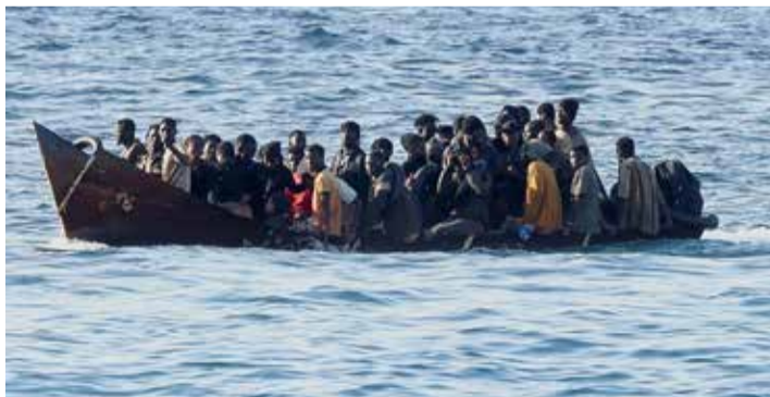
Des migrants en route vers l'île de Lampedusa...

sion de clandestins ne pouvant invoquer le droit d'asile. L'Italie a aussi conclu une série d'accords, avec la Tunisie et l'Égypte, pour faciliter les rapatriements. Le dispositif compte un centre de rapatriement «ac-