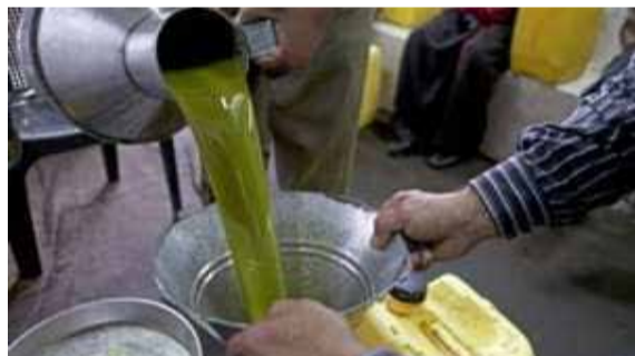
Un produit essentiel devenu hors de prix...

Dans le commerce, les prix de l'huile d'olive, produit très prisé par les Marocains, affichent des prix stratosphériques. La lampante, de qualité infé-