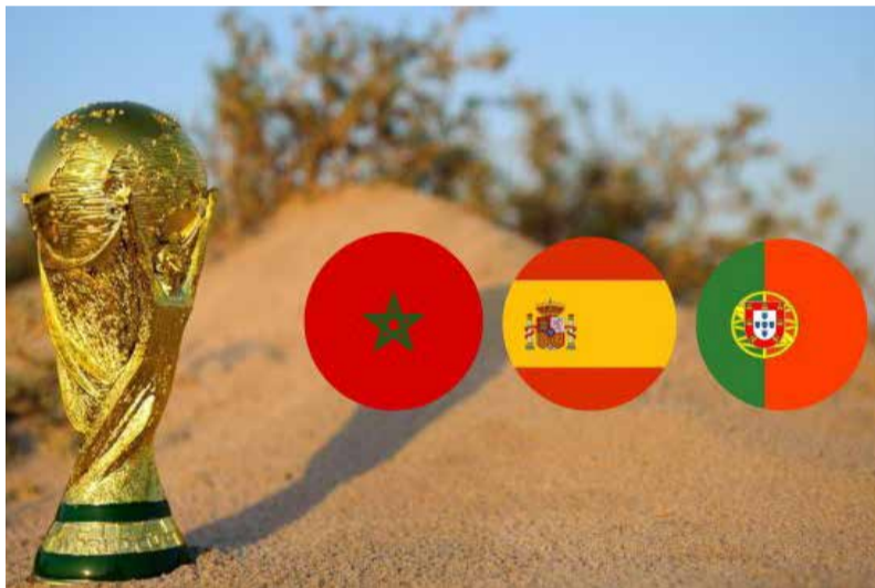
Une candidature tripartite solide qui fait sens...

L'édition 2030 du mondial aura lieu au Maroc, en Espagne et au Portugal. Mais aussi dans trois pays d'Amérique Latine où se joueront à titre symbolique les trois premiers matches.