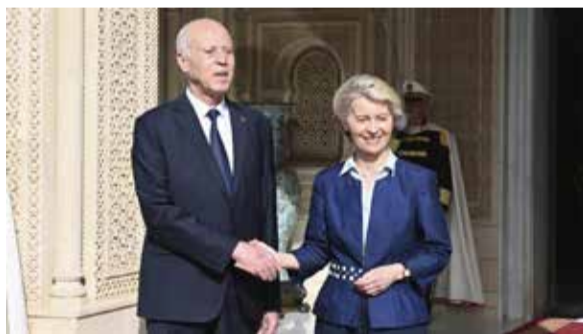
La présidente de la commission européenne Ursula Von Der Leyen avec Kaïs Saïed en Tunisie.

La Tunisie est, avec la Libye, le principal point de départ des milliers de migrants qui traversent la Méditerranée centrale vers l'Europe, et arrivent en Italie. Confrontée à un déferlement incessant de migrants sur ses côtes, la coalition dirigée par la première ministre Giorgia Meloni a adopté une série de mesures pour accélérer les procédures d'expul-