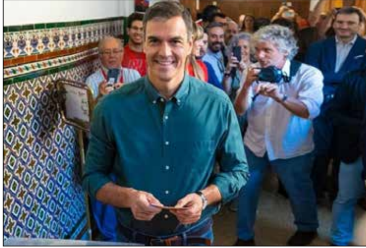
Le pouvoir va-t-il lui sourire de nouveau ?

Des négociations très délicates s'annoncent désormais pour Pedro Sánchez, appelé à trou-