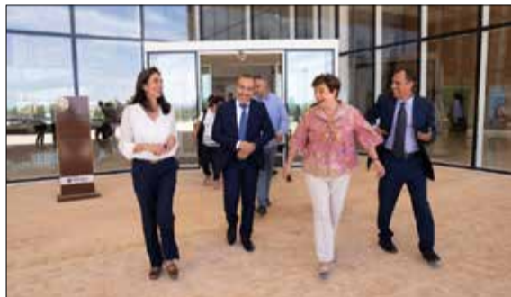
La directrice générale du FMI Christalina Georgieva lors de sa visite du site des travaux annuelles du FMI et de la Banque mondiale à Marrakech.

P as une seule chambre de disponible à Marrakech du 9 et 15 octobre. Toute la capacité litère de la ville ocre est réservée pendant cette période pour les quelque 14.000 participants venus du monde entier aux Assemblées générales du FMI et de la Banque mondiale. Maintenu par les deux institutions de Bretton Woods après le séisme qui a frappé le Haut-Atlas, cet évènement international aux effets d'entraînements