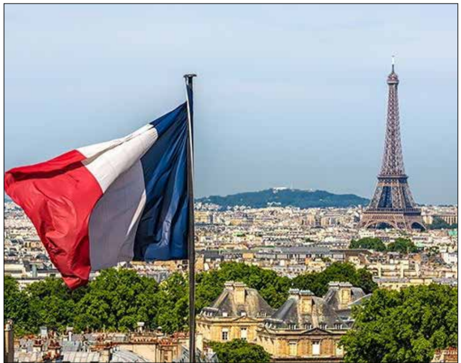
La France ou la stigmatisation permanente des musulmans...

Autre témoignage dans la même veine émanant de A.L, veuve avec 3