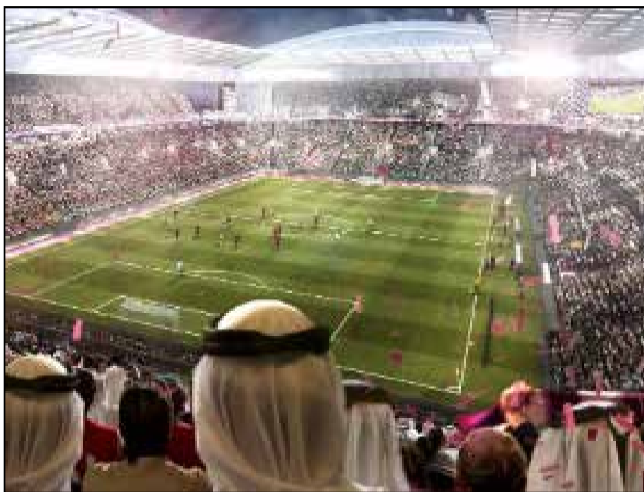
Une fête planétaire bordée par le conservatisme du pays hôte.

Pour la coupe du monde du Qatar qui commence dimanche 18 novembre et se termine dimanche 18 décembre, le pays hôte a posé ses conditions. Et quelles conditions ! Détaillées dans un long document, intitulé «Qatar – Do's and Don'ts 2022» (à faire et à ne pas faire), rendu public récemment par le comité d'organisation, elles fixent les règles pour les supporters en termes de code vestimentaire, vie en public et consommation de breuvages. Au Qatar on ne badine pas avec ces choses-là. Faute de quoi, la sanction tombe. S'agissant des consignes vestimentaires, le comité d'organisation rappelle pour ceux qui ne le savent pas que la société qatarie est conservatrice. Dans ce sens, les visiteurs sont tenus de porter des vêtements couvrant les épaules et les genoux pour les hommes. Pour les femmes, des pantalons ou jupes longues ainsi qu'un haut recouvrant la poitrine et la nuque sont nécessaires. Si la voile n'est pas obligatoire excepté dans les mosquées, le document indique que son port est apprécié en vue de «s'intégrer et respecter la culture locale et éviter les attentions indésirables.» Quant à l'attitude à adopter envers les femmes,