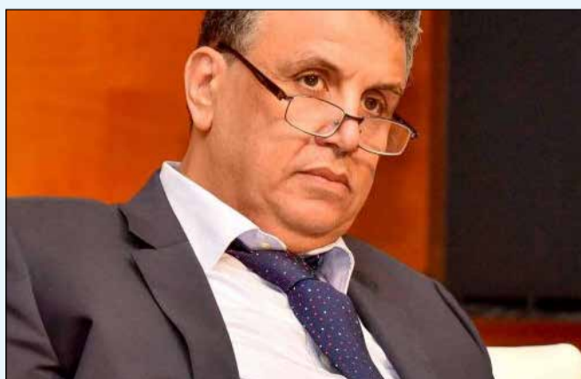
Abdellatif Ouahbi, ministre de la Justice.

La goutte qui a fait déborder le vase aura été le cavalier seul du ministre sur l'élaboration de l'avant-projet de loi réglementant l'exercice la profession et son propos récent tenu sur les