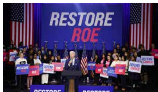
Joe Biden, lors d'un meeting à Washington, 18 octobre 2022.

En juin, la Cour suprême des États-Unis a annulé la décision Roe vs Wade de