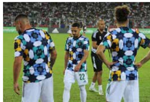
Le maillot du Onze algérien du football avec des motifs du zellige marocain.

disant opposée à « tout acte qui porte atteinte à l'intégrité culturelle et à l'histoire des peuples et nations dans le monde ». Le