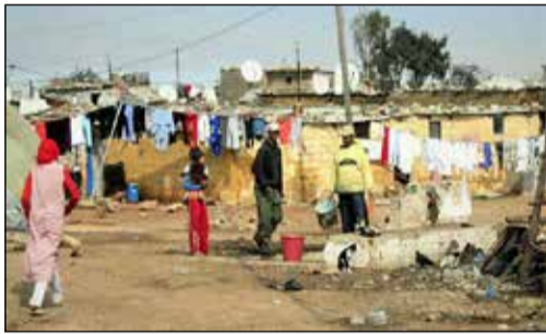
Des années d'efforts anéantis....

Le Maroc a retrouvé ses niveaux de pauvreté de 2014 ! Et c'est une enquête du Haut-commissariat au plan (HCP) qui révèle cette triste réalité. En cause, les conséquences désastreuses de la crise pandémique (pertes d'emplois et de revenus...) et les effets ravageurs de la guerre en Ukraine (inflation, vie chère...) qui ont fait basculer près de 3,2 millions de Marocains dans la pauvreté ou la vulnérabilité. Ce qui signifie l'anéantissement de 7 années d'efforts soutenus, déployés par les pouvoirs publics pour faire sortir de l'indigence une partie de la population. Retour donc à la case départ pour ces catégories qui n'ont plus les moyens de se nourrir correctement en raison de la flambée des denrées alimentaires. Nous sommes face à une détresse sociale croissante qui appelle de la part du gouvernement une réponse à court terme pour venir en aide aux nouveaux pauvres et la mise en place d'une stratégie nationale de prévention et de lutte contre la pauvreté. Celle-ci passe prioritairement par l'éducation et la lutte contre les inégalités sociales, de telle sorte d'empêcher la reproduction de la pauvreté.