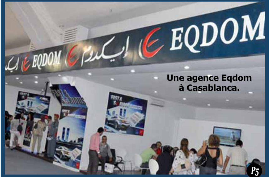
Une agence Eqdom à Casablanca.