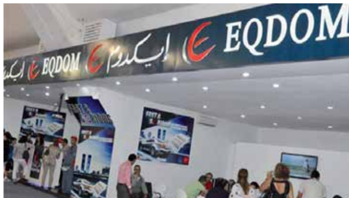
Une agence Eqdom à Casablanca.

aller récupérer dans la succursale de votre choix. Cette longue attente est justifiée par les responsables par le fait que le dossier du client doit passer par plusieurs services dont celui de la comptabilité pour qu'ils vérifient tous avant d'entreprendre de délivrer le précieux document attestant que vous avez réglé votre crédit jusqu'au dernier centime... Du grand n'importe quoi ! Bonjour l'approche client. Elle roule magnifiquement bien chez Eqdom. Au-