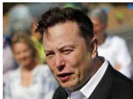
Elon Musk