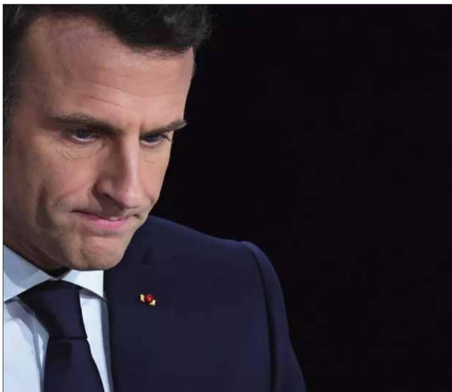
La France de Macron semble avoir choisi son camp au Maghreb...

Il y a de quoi en perdre son «français» ! En cause, le rejet croissant pour des motifs souvent jugés non valables des dossiers de visas déposés par les Marocains depuis la réouverture des frontières en février 2022. Dans le lot des « recalés » figurent parfois des personnalités, des hommes d'affaires, des médecins et même des étudiants pour lesquels l'obtention du visa était en d'autres temps - qui semblent désormais lointains - une simple formalité. Ces refus en chaîne, vécus comme une humiliation profonde par les intéressés et qui n'arrêtent pas d'empoisonner le climat bilatéral tout en ali-