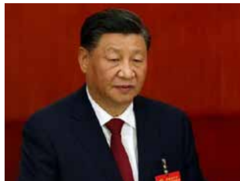
Xi Jinping.

port aux 10,6 millions de l'an dernier - déjà en baisse de 11,5 % par rapport à 2020. Les autorités ont imposé une politique de l'enfant unique de 1980 à 2015, passant ensuite à une politique de trois enfants, reconnaissant que la nation est au bord d'un ralentissement démographique. Son taux de fécondité de 1,16 en 2021 était inférieur à la norme de 2,1 de l'OCDE pour une population stable et parmi les plus bas du monde. Au cours de l'année écoulée, les autorités ont introduit des mesures telles que des déductions fiscales, un congé de maternité plus long, une assurance médicale améliorée, des subventions au logement, des fonds supplémentaires pour un troisième enfant et une répression des cours particuliers coûteux. Pourtant, le désir des femmes chinoises d'avoir des enfants est le plus faible du monde, selon une enquête publiée en février par le groupe de