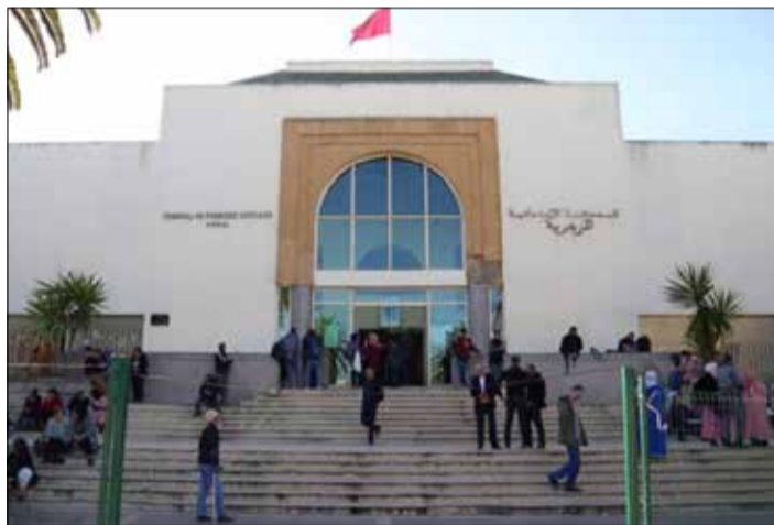
Une affaire troublante.

L'homme de la vidéo ajoute que ceux qui ont ruiné sa vie - il affirme avoir emprunté l'argent demandé et vendu sa voiture - sont membres d'un réseau ayant le bras long, capables de faire condamner des innocents et d'innocenter des coupables. Celui qui raconte par le menu son calvaire judiciaire monté de toutes pièces affirme détenir les preuves de tout ce qu'il raconte sous forme de retranscription de communications téléphoniques accablantes pour ces professionnels d'extorsions de